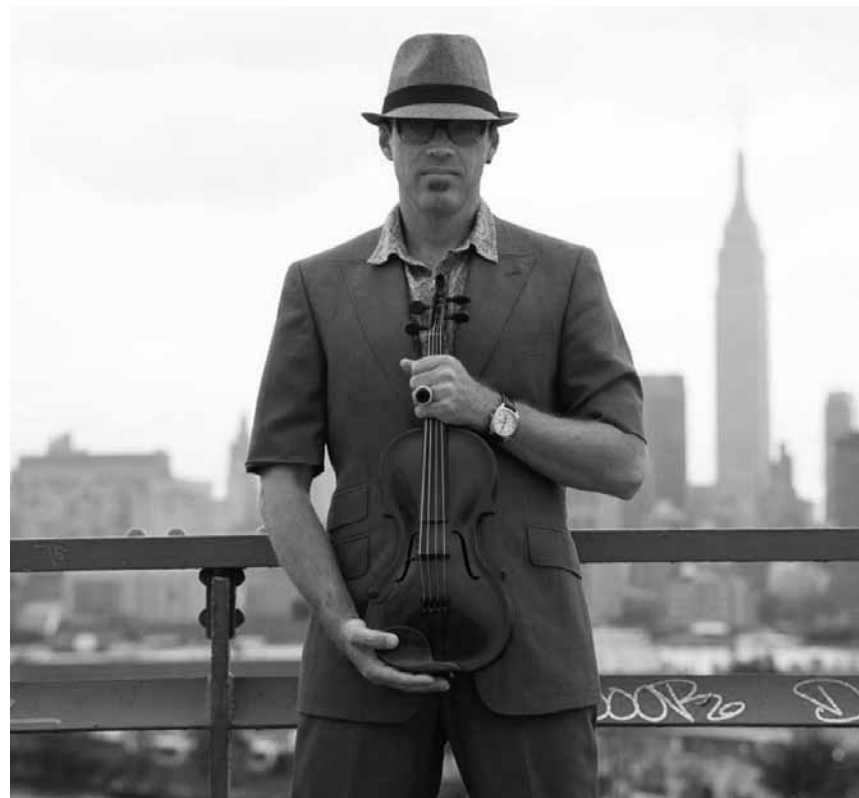
Nein, keine lateinische sondern eine latein-amerikanische Geige macht am 2. Oktober in Niederanven halt: „El Violin latino“.

Prodiges ou les propos d'un prestidigitateur , avec David Goldrake, Forum Geesseknäppchen, Luxembourg, 19h30.