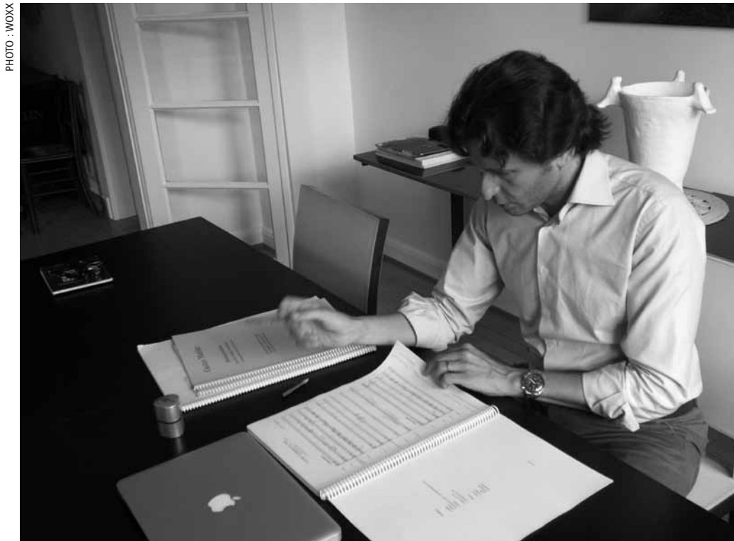
Studieux, Gustavo Gimeno prépare une semaine chargée à la Philharmonie.