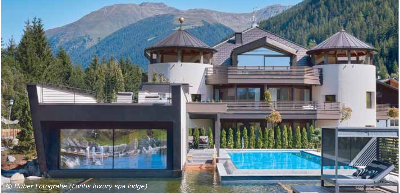
(Fontis luxury spa lodge)

Die Fontis Luxury Spa Lodge im Gsieser Tal ist ein Sehnsuchtsort. Mitten im Grünen laden acht Lodge-Suiten ein, Privacy pur und Wellness auf höchstem Niveau zu genießen. Eine traumhafte Landschaft und wohltuende Ruhe umarmen die luxuriöse Lodge. Ein herrlicher Ort, um den Sommer zu genießen.