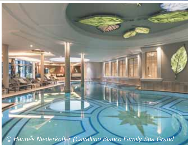
© Hannes Niederkofler (Cavallino Bianco Family Spa Grand)

Wenn die Sommerhitze vorbei ist, dann starten Familien mit Kindern aktiv durch. Die Herbstferien wollen genossen werden. Frische Bergluft und viel Bewegungsfreiheit in der Natur sind eine gute Wahl. Im Cavallino Bianco Family Spa Grand Hotel im UNESCO Weltnaturerbe Dolomiten finden Familien all das und noch viel mehr: Wasserwelten und ein Spa zum Kuscheln, Träumen und Relaxen. Eine großzügige Kinderbetreuung vom Baby bis zum Teenager schafft Frei-Zeiten für Eltern. In- und outdoor dreht sich alles um Spiel, Spaß und Abenteuer für die Kinder. Gut essen, sich verwöhnen lassen, Lebensfreude pur – das Cavallino Bianco wurde von TripAdvisor mehrfach als das beste Familienhotel weltweit ausgezeichnet.