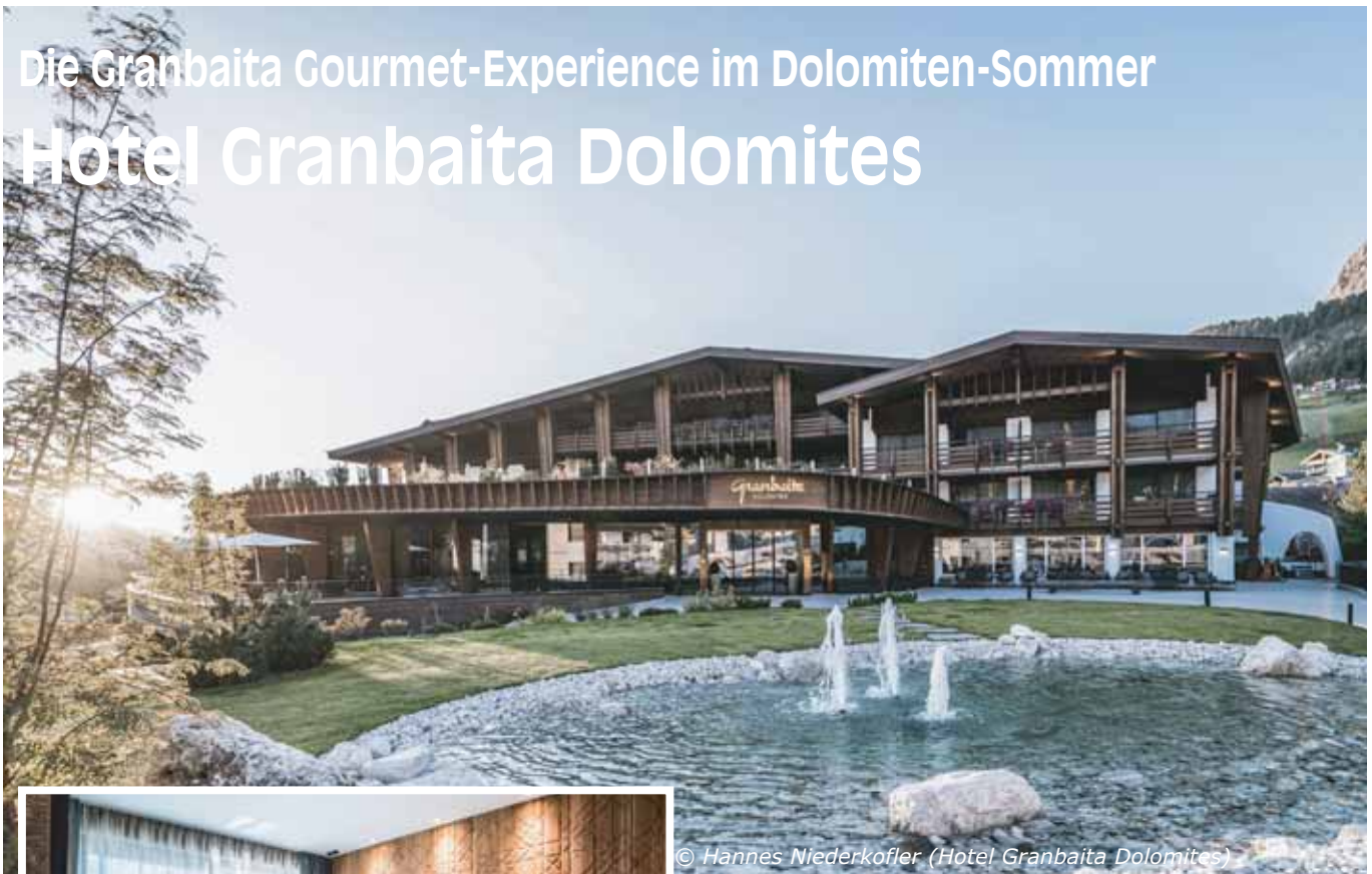
© Hannes Niederkofler (Hotel Granbaita Dolomites)