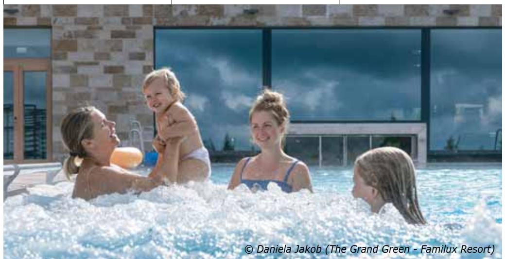
(The Grand Green - Familux Resort)