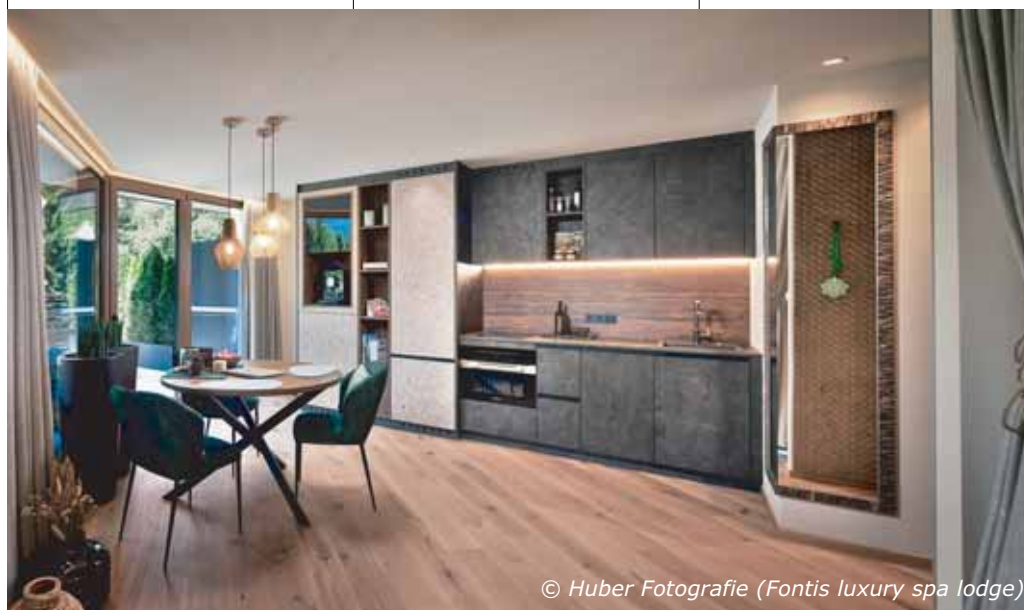
(Fontis luxury spa lodge)