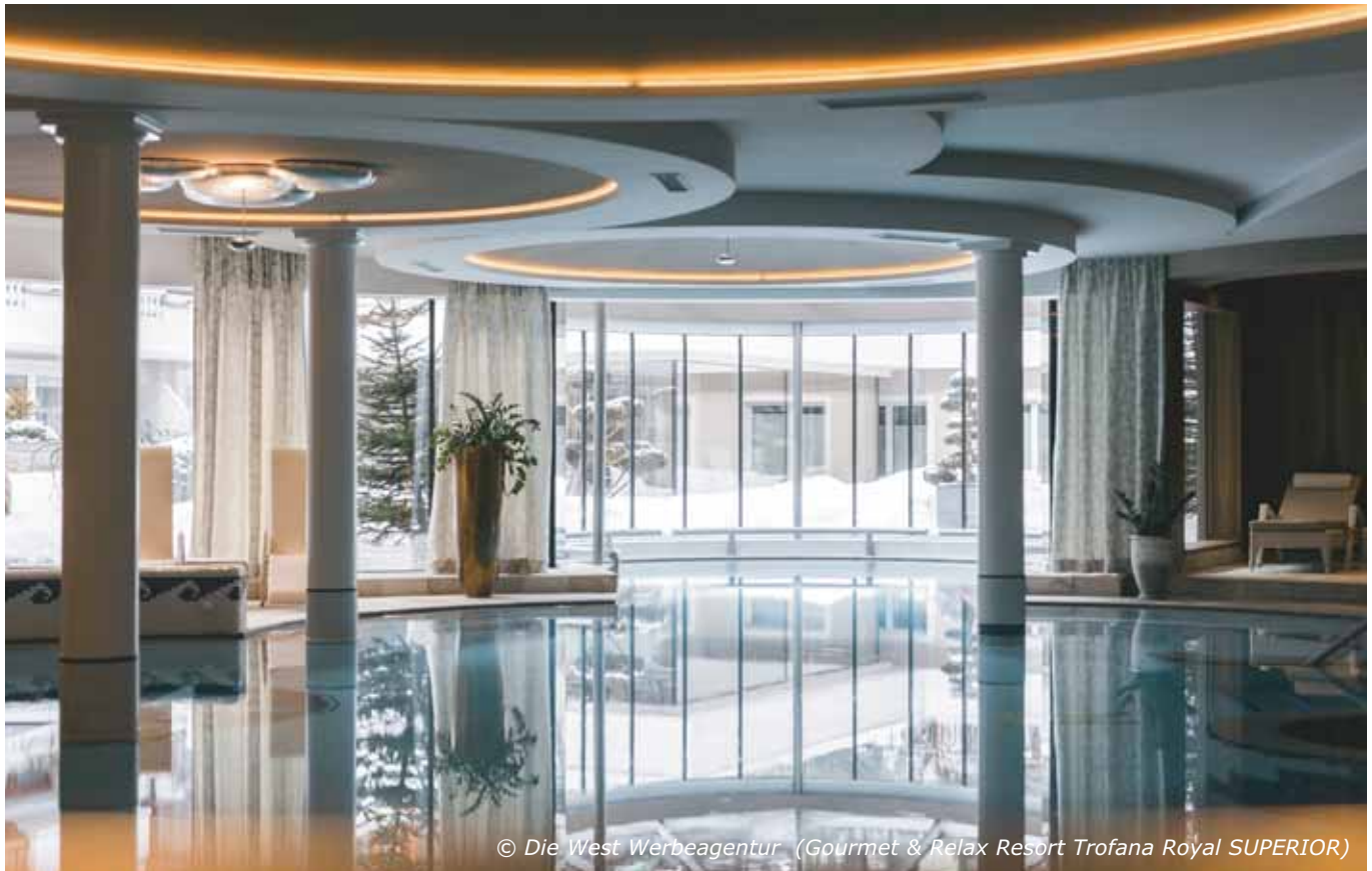
(Gourmet & Relax Resort Trofana Royal SUPERIOR)