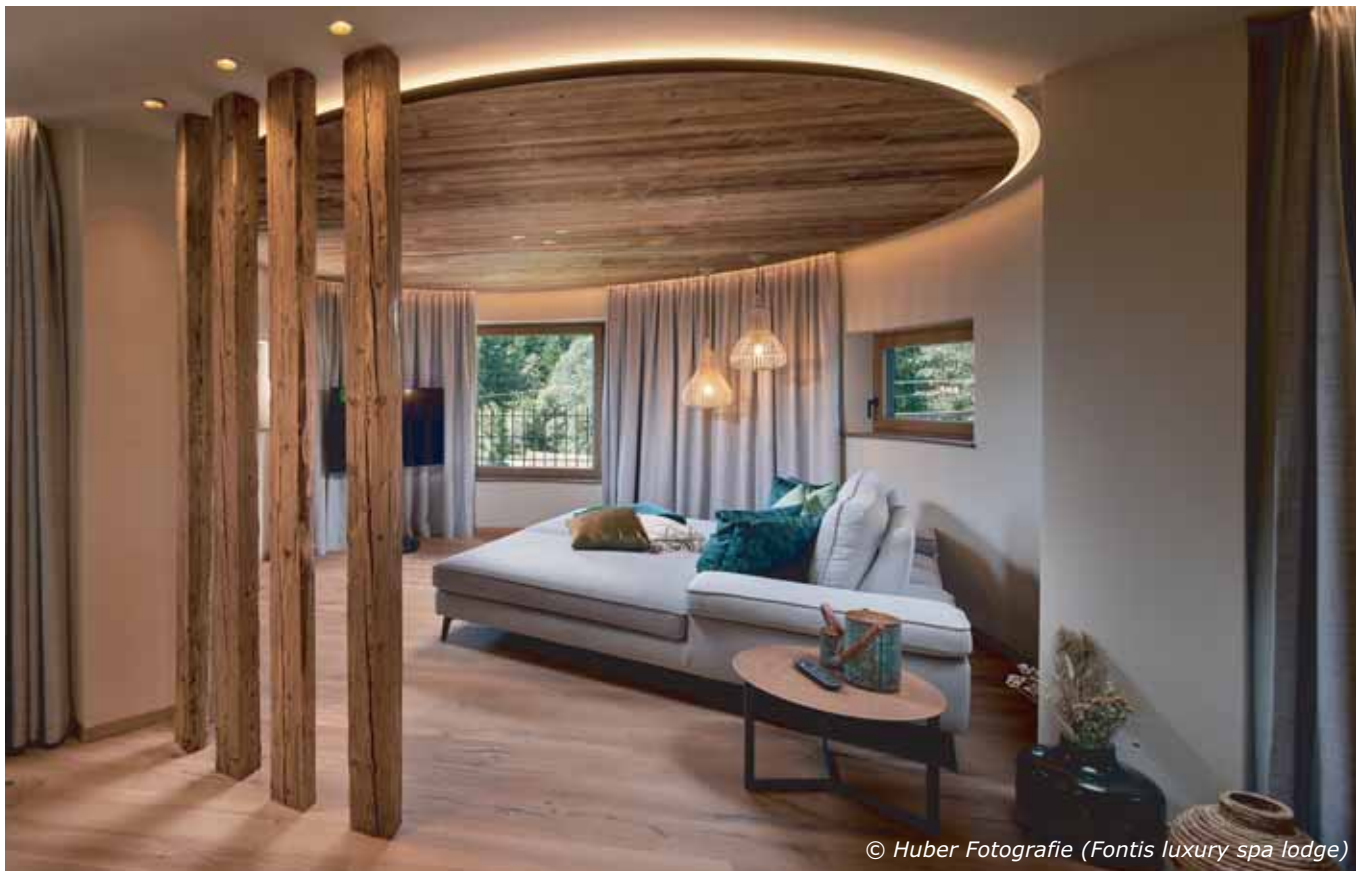
(Fontis luxury spa lodge)