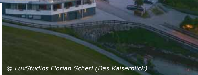
(Das Kaiserblick)