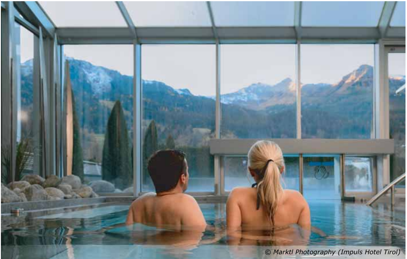
© Markt Photography (Impuls Hotel Tirol)

ne saugen die Heilkräfte des Waldes auf. Die Natur konzentriert zu genießen, belebt den Geist und bringt das Innere zur Ruhe. Auch geführtes Waldbaden ist möglich.