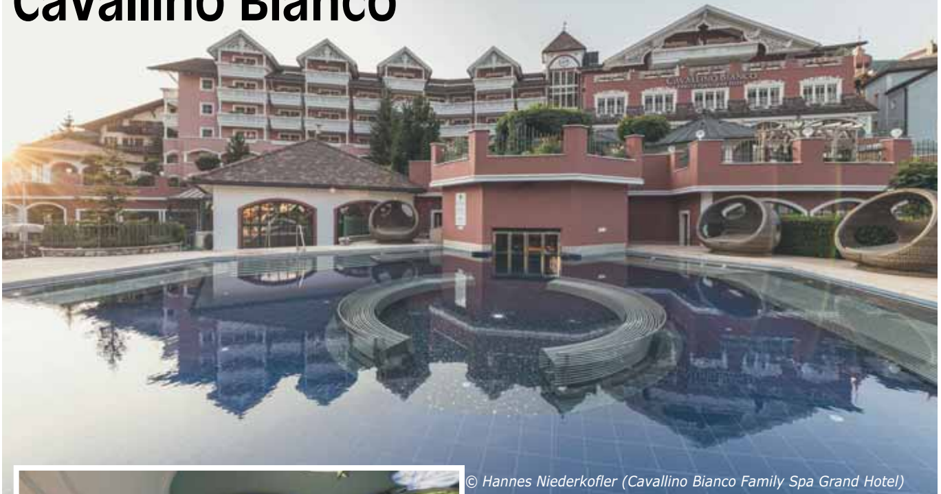
© Hannes Niederkofler (Cavallino Bianco Family Spa Grand Hotel)