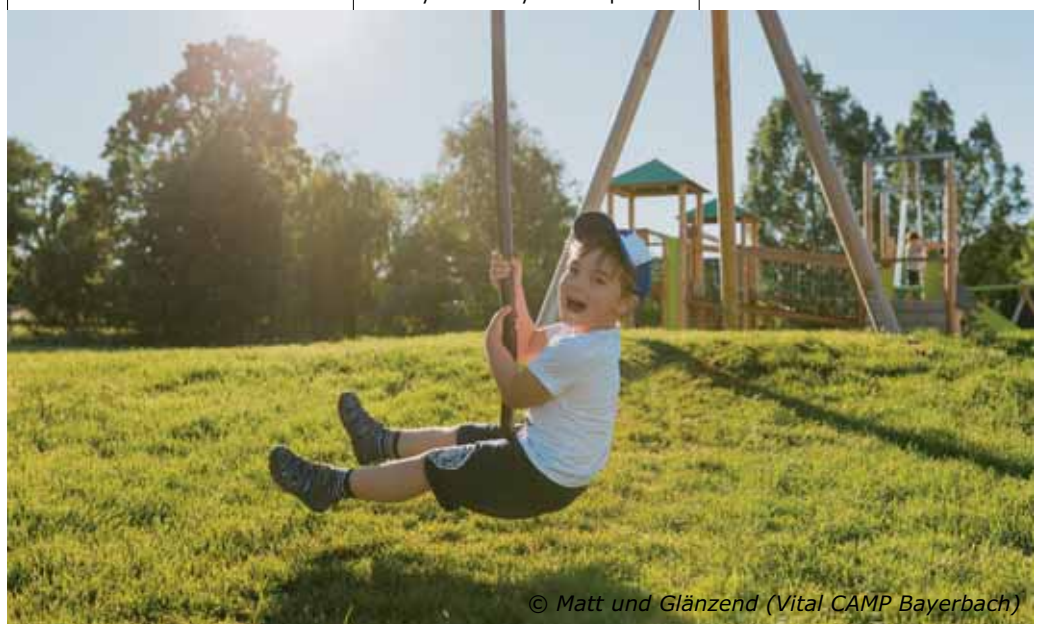
© Matt und Glänzend (Vital CAMP Bayerbach)