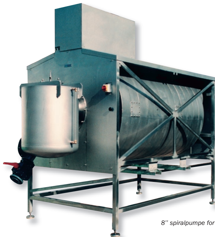
8" spiralpumpe for pumpning af rejer

Har din virksomhed brug for en enkelt produktions- eller transportfunktion, eller er der behov for at se på hele produktionsflowet fra råvare til færdigt distribuerbart produkt - så leverer vi gerne et konkurrencedygtigt løsningsforslag.