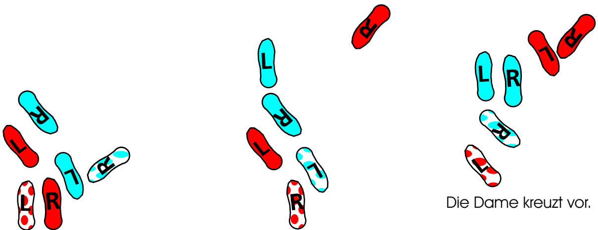
vom Hilfstext "links- her- um" -> "links-"