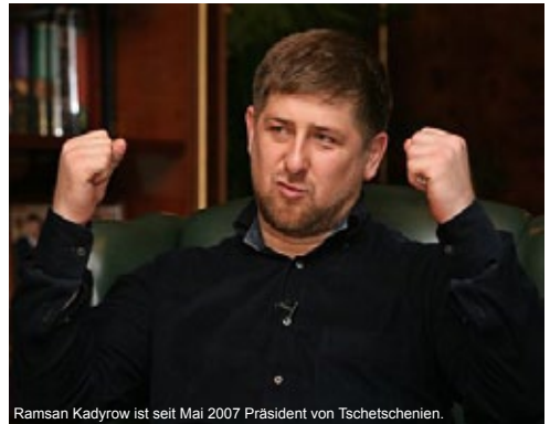
Ramsan Kadyrow ist seit Mai 2007 Präsident von Tschetschenien.

Fußball habe nichts mit Politik zu tun, schiebt er später noch nach.