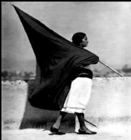
Tina Modotti: Woman with Flag

Michail Bakunin (1814-1876), Begründer des kollektivistischen Anarchismus