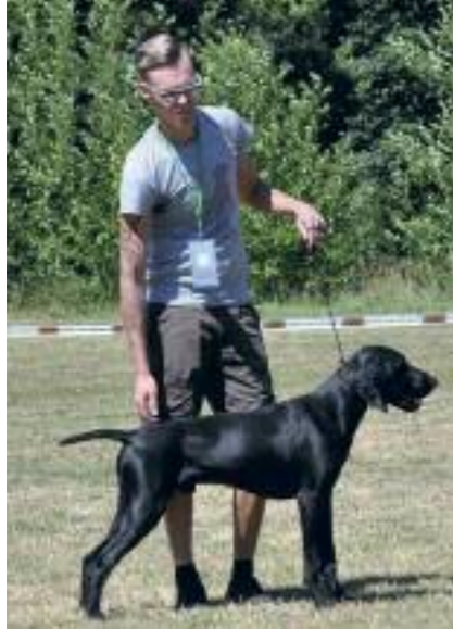
V1-Rüde „Artus vom Böhlgrund“