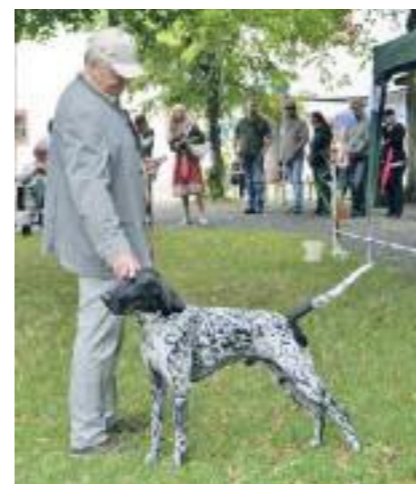
Panter vom Riverwoods