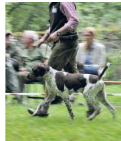
Jester KS Anjules