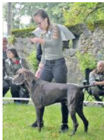
Eros KS vom Hirschenacker

den Moderatoren waren unsere DK-Freunde aus Österreich und auch aus der Schweiz angereist. Für Essen und Trinken sorgte das Team der Burggaststätte und auch zwei Stände mit DK-Präsenten und Leinenzubehör etc.