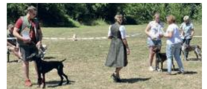
Altersklasse Hündinnen V1 - V3