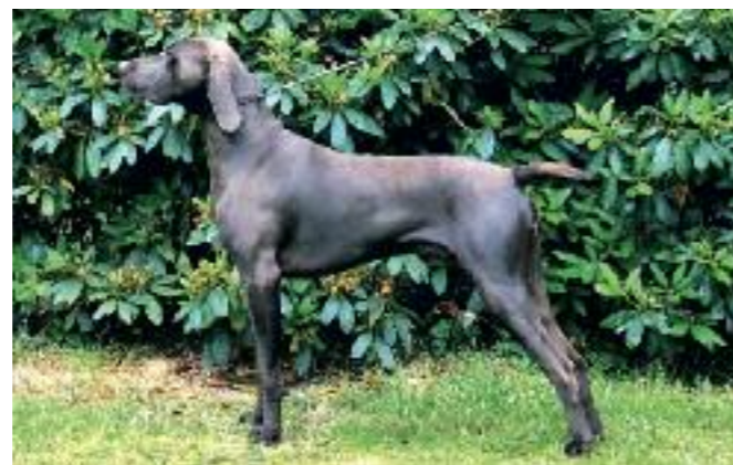
Bester Rüde in der JK: Wentus vom Isenseer Kajeideich, SG1