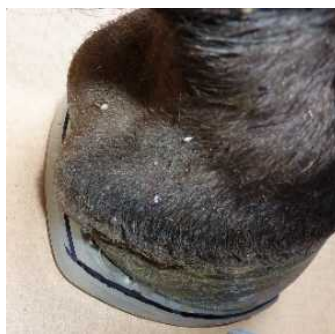
Abbildung 7: Anzeichnen Trachtenüberstand