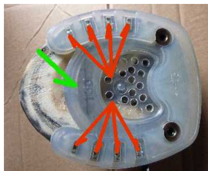
Abbildung 4: Position Metallkern (grün) und Nagelgesenke (rot)

Die richtige Beschlagsgrösse wird ausgewählt, indem der vordere Steg mit dem Metallkern in die jeweils passende Position zum Hufbeinrand (s.o.) gelegt wird. Dabei müssen die Nagelgesenke über der weissen Linie der Wand liegen.