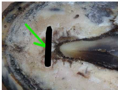
Abbildung 1: Markieren der Hufbeinspitze am Sohlenhorn