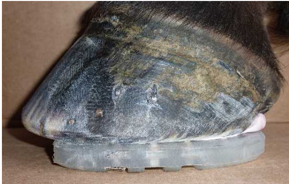
Abbildung 8: Fertiger Beschlag

Die Hufzehe ist nach dem Vernieten stark zu berunden, dabei dürfen aber keine abrupten Radienübergänge am Hufumfang entstehen.