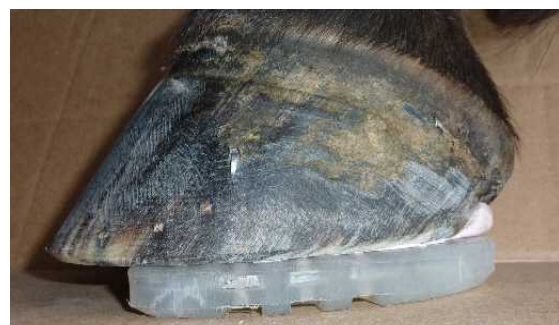
Abbildung 7: mit 2 Nägeln fixiert...