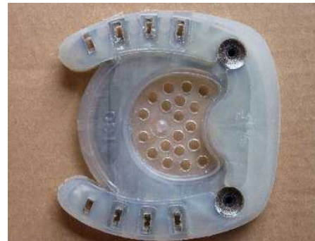
Abbildung 8: fertig geschliffener Beschlag mit Trachtenrichtung