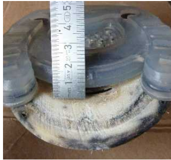
Abbildung 5: Abstand Sohle - Steg

Der vordere Steg muss einen Mindestabstand von ca. 5mm zur darüberliegenden Sohle aufweisen. Ist dies nicht der Fall, beispielsweise bei sehr flacher Sohle, kann die Kunststoffhebung des Steges flach geschliffen werden. Auch von vorne kann der Steg bis kurz vor den Metallkern zurückgeschliffen werden. Dabei ist jedoch darauf zu achten, dass zur Hufsohle hin keine Kanten oder punktuelle Vorsprünge entstehen, der Steg muss sich quasi in die Sohle „einschmiegen“.