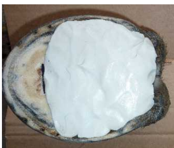
Abbildung 6: Abmessen der richtigen Polstermenge