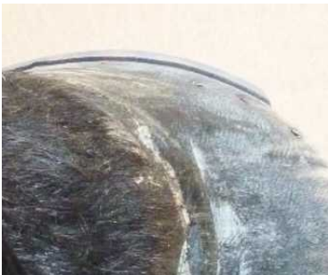
Abbildung 6: seitlicher Überstand - Markierung zum Schleifen

An den Seitenwänden sollte der Beschlag einen Überstand von ca. 2mm je Seite aufweisen, er kann noch etwas angefast werden, um ein Abtreten zu verhindern. Der Beschlag sollte nicht allzu weit über die Trachten nach hinten hervorstehen, überschüssiges Material kann jeweils weggeschliffen oder abgeschnitten werden. Am hinteren Steg ist bodenseitig eine Trachtenrichtung anzubringen, die etwas vor den Trachtenenden beginnt.