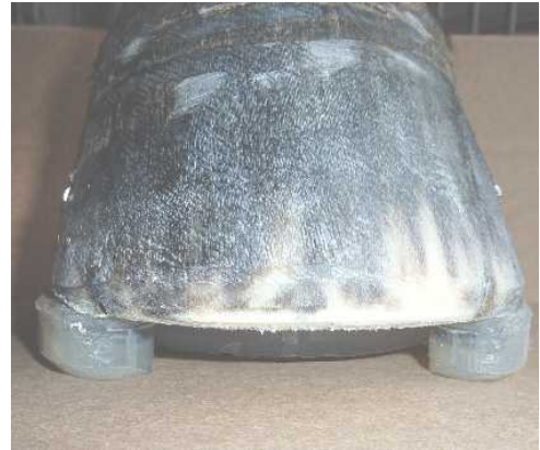
Abb. 9: Weiche Radienübergänge!