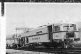
UNIMAT 08-275 3S

Selbstverständlich Qualitätsstandard nach ISO 9001