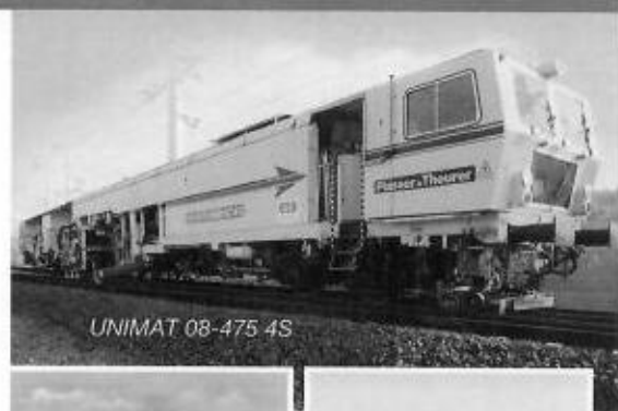
UNIMAT 08-475 4S

Die Stopftechnologie mit Schwenkpickel und seitenverschiebbaren Stopfaggregaten garantiert optimale Schwellenaufleger im Kreuzungsbereich Schwelle/Schiene und an schwer zugänglichen Stellen.