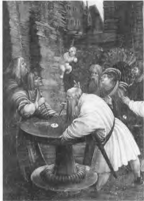
Darstellung der angeblichen Hostienschändung durch Juden in Pulkau auf dem Flügelaltar in der Heiligblutkirche in Pulkau (um 1500)

des Juden Merchlin gefunden, der seit mindestens einem Jahrzehnt in Pulkau ansässig war. 445 Die darauffolgende Ermordung der jüdischen Bevölkerung Pulkau löste eine regelrechte Welle von Judenverfolgungen aus, 446 der nicht nur in Niederösterreich, sondern auch im angrenzenden Böhmen und Mähren zahlreiche Juden zum Opfer fielen: auf der österreichischen Seite waren neben Pulkau noch Eggenburg, Retz, Horn, Zwettl, Raabs, Falkenstein, Feldsberg/Valtice, Hadersdorf am Kamp, Gars, Rastendorf, Mistelbach, Weiten, Emmersdorf, Tulln, Klosterneuburg, Langenlois, St. Pölten, Laa und Drosendorf betroffen. In Mähren wurden Znaim/Znojmo, Erdberg/Hrádek, Jamnitz/Jemnice, Fratting/Vratěnín, Trebitsch/Třebíč und Mährisch Budweis/Moravské Budějovice und in Böhmen Neuhaus/Jindřichův Hradec Schauplätze von Verfolgungen. Diese Liste basiert auf den zahlreichen Berichten über die blutigen Ereignisse in der christlichen Historiographie 447 sowie auf der wichtigsten jüdischen Quelle, dem Martyrologium des Nürnberger Memorbuches. 448