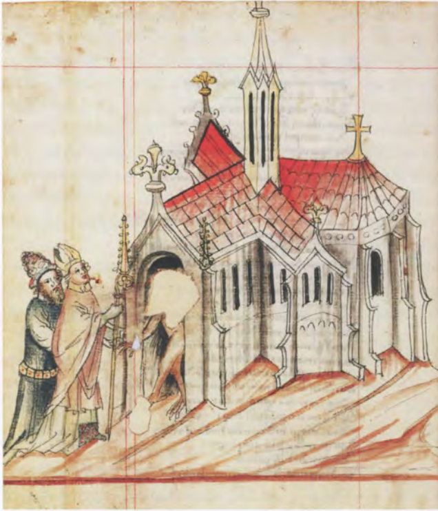
Bischof und (durch Kleidung und physische Attribute als Jude gekennzeichnet) Wucherer, denen aus einem durch Wuchergewinn finanzierten Kirchenbau der Teufel entgegentritt. Illustration zum Traktat »Der Renner« des Hugo von Trimberg in einer Handschrift von 1426

fugnisse der weltlichen Herrscher eingriff. Kanon 70 verbot Juden, die sich freiwillig hatten taufen lassen, die Rückkehr zu ihrem alten Glauben; damit wurde Zwangsgetauften eine solche Rückkehr indirekt ermöglicht, was nicht in allen früheren kirchlichen Regelungen dieser Frage der Fall gewesen war und wahrscheinlich als Mißbilligung der Praxis der Zwangstaufen von Juden im Zuge der Kreuzzugsverfolgungen zu sehen ist.