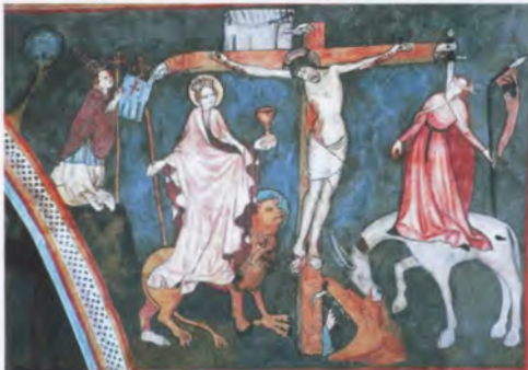
»Lebendes Kreuz« in der Franziskuskirche von Poniky (Slowakei) aus dem Jahr 1415. Links die Figur der Ecclesia auf dem Tetramorph mit Krone, Kreuzstab und Kelch; rechts die von einem Schwert durchbohrte Synagoge, mit verbundenen Augen auf einem verletzten Esel stehend, in der Hand eine gebrochene Lanze mit einem Wimpel, auf dem ein Bockskopf abgebildet ist

Nach den Verfolgungen der Kreuzzugsepoche, die 1196 den jüdischen Münzmeister Schlom und seine Familie das Leben kosteten, stellt sich das 13. Jahrhundert in den Quellen als eine Zeit des vergleichsweise friedlichen Zusammenlebens von Christen und