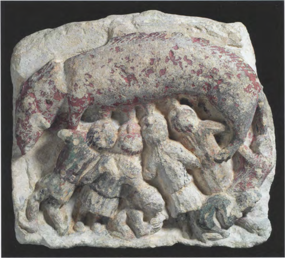
Wiener Neustädter »Judenspott« (15. Jahrhundert). Die Darstellung von Juden, die an den Zitzen einer Sau trinken, war im Spätmittelalter ein gängiges judenfeindliches Motiv.

Österreich, der auch den Schutz über sie in Anspruch nahm. Die österreichischen Judenprivilegien von 1397 und 1401, die ausdrücklich auch für die Juden von Wiener Neustadt und Neunkirchen galten, stellten der österreichische Herzog Albrecht IV. und der steirische Herzog Wilhelm gemeinsam aus. 228