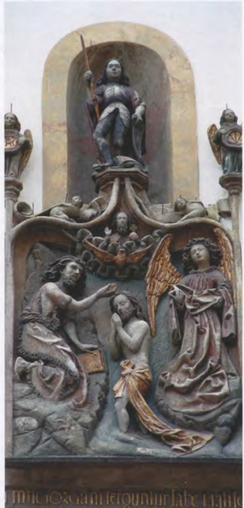
Spätgotisches Relief mit der Taufe Jesu im Jordan und judenfeindlicher Inschrift zur Erinnerung an die Wiener Gesera am »Haus zum großen Jordan« auf dem Judenplatz in Wien (1497)