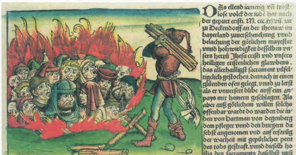
Darstellung einer Judenverbrennung in der Weltchronik des Hartmann Schedel von 1493

Im Gegensatz zum habsburgischen Gebiet kam es 1349 im Territorium des Erzbischofs von Salzburg zu Pestverfolgungen, die neben der Stadt Salzburg auch Laufen, Mühlendorf und möglicherweise Hallein getroffen haben dürften, über die jedoch sehr wenig bekannt ist. Die Mattseer Annalen, die die Verfolgung in Salzburg erwähnen, berichten außerdem von Pestverfolgungen im zu Bayern gehörigen Braunau. 458 In den Bamberger Besitzungen in Kärnten – vor allem in Wolfsberg, möglicherweise auch in Villach – dürfte es ebenfalls zu Verfolgungen gekommen sein. 459 In Tirol fielen die Innsbrucker Juden einer Verfolgung zum Opfer. 460