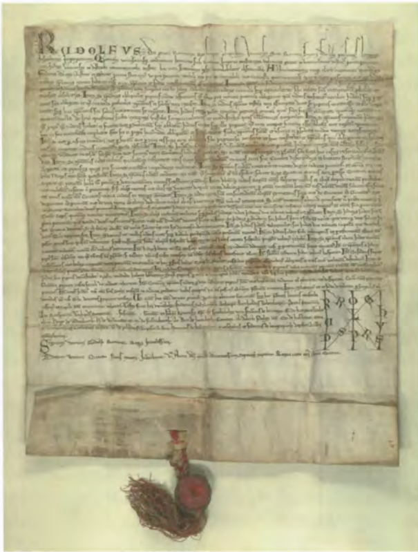
Privileg Rudolfs von Habsburg für die österreichischen Juden vom 4. März 1277. Anstelle des im Text angekündigten Siegels König Rudolfs hängt an der Urkunde aus unbekanntem Gründen das Siegel Graf Bertholds von Hardegg.

nahe, daß König Rudolf hier bereits auf eine Erwerbung Österreichs durch sein Haus hinarbeitete und daher den landesfürstlichen Herrschaftsanspruch über die Juden zu stärken versuchte, während er in anderen Teilen des Reiches eine gegenteilige, auf Stärkung der königlichen Position bedachte Judenpolitik verfolgte. 74