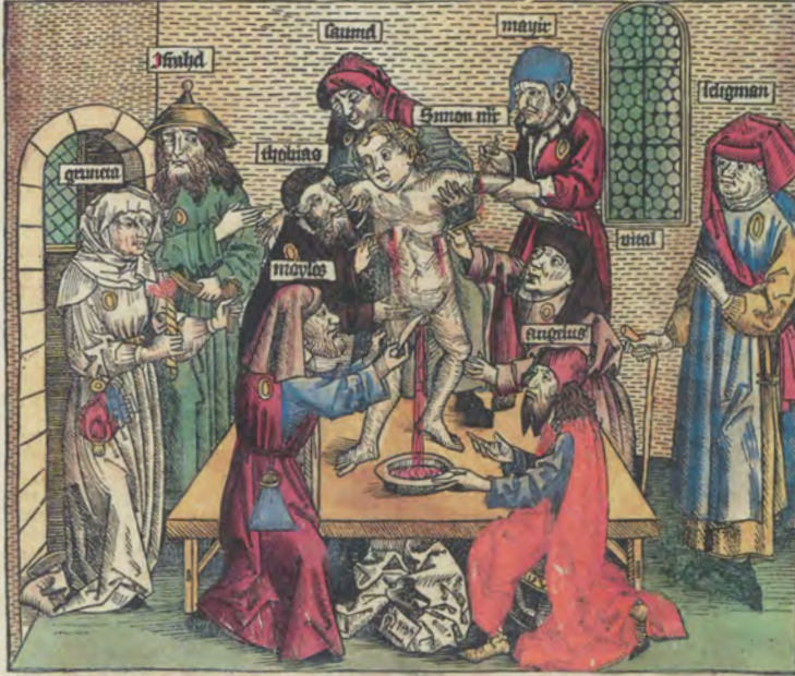
Darstellung des angeblichen Ritualmordes an dem Kind Simon, der den Juden in Trient 1475 vorgeworfen wurde, in der Schedelschen Weltchronik (1493)

Q ō simile etiā scel 9 ap̄d motā oppidū qd̄ ē i finib 9 agri fori iulij p̄ d̄nquēnū iudei pegerit. Nā etiā ali- um puerū sili mō mactauerūt, p̄ q̄ tres eoz captiui venetijs missi fuerit ⁊ atroca supplicio p̄remati st. T erum thurbū inferozem ingressi missam magna cedē sternunt. Dehinc magnā genuensium vrbē ca- p̄bam quā ad meotidem adhuc possidebant. Venenses expugnant, ciuitas populosa ⁊ mercatoribus plurimū apta iuit hoc anno eius genuesis eā prodente in turcoꝝ man. veniens in litore, euz in maris sita,