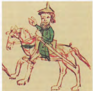
Darstellung eines berittenen, bewaffneten Juden in einer Sachsenspiegel-Handschrift. Wenn Juden Waffen trugen, verloren sie den erhöhten Schutz, der ihnen ansonsten seit dem kaiserlichen Reichslandfrieden 1103 zukam.

Das Vorrecht, die Juden im Reich zu schützen, wurde ab dem späten 11. Jahrhundert primär vom Kaiser beansprucht. Anlässlich der schweren Judenverfolgungen des Ersten Kreuzzuges erwies sich der bisher in Form von einzelnen Privilegien gewährte Schutz als unzureichend; daher wurden die Juden 1103 neben Klerikern, Kaufleuten und Frauen erstmals als besonders schutzwürdige Gruppe in den kaiserlichen Reichslandfrieden aufgenommen. 49 Dieser erhöhte Schutz, so präziserte der Sachsenspiegel spä-