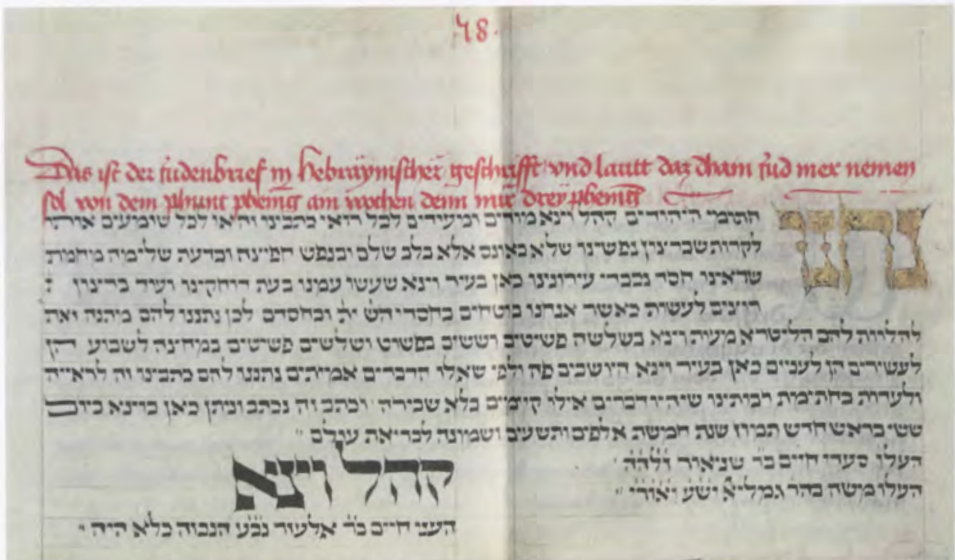
Hebräische Urkunde der Vertreter der Wiener Jüdischen Gemeinde über die Absenkung des Zinssatzes bei Darlehen an Wiener Bürger (»Wiener Zinsrevers«, 1338 Juni 19). Zeitgenössische, mit deutscher Übersetzung versehene Kopie im »Eisenbuch« der Stadt Wien

Die angegebenen Zinssätze schwankten anfangs zwischen sechs und acht Pfennig pro Pfund und Woche; im 14. Jahrhundert sanken sie auf zwei bis drei Pfennig ab. Dies ist kein auf die jüdischen Darlehen beschränktes Phänomen, denn die Zinshöhe war auch in anderen Bereichen, zum Beispiel bei Renteneinkommen, seit dem 14. Jahrhundert rückläufig. 148 Zudem schwankte die Höhe der Zinsen je nach Person und Bonität des Schuldners, den gestellten Sicherungen sowie der Laufzeit und Art des Kredits, dazu kamen regionale Unterschiede.