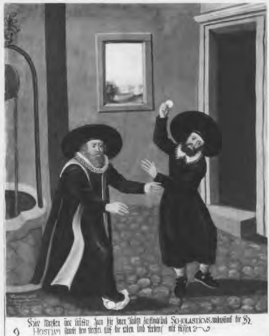
Darstellung der angeblichen Korneuburger Hostienschändung, Teil eines ursprünglich aus zwölf Bildern bestehenden Zyklus im Korneuburger Augustinerkloster (17. Jahrhundert)

Mit diesen lapidaren Worten berichtet eine Klosterneuburger Annalenhandschrift über die bis dahin größte bekannte Judenverfolgung im mittelalterlichen Herzogtum Österreich. 434 Nach dem frühesten bekannten Fall in Laa 1294 wurde somit zum zweiten Mal der Vorwurf der Hostienschändung zum Anlaß für den Ausbruch von Gewalt gegen die jüdische Bevölkerung eines Ortes. Zudem kam rasch das Gerücht auf, die