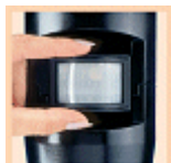
Einstellung durch Schwenken