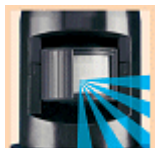
Reduzierung des Erfassungswinkels