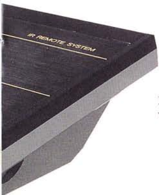
Eine einzige Fernbedienung für die HiFi-Anlage, den Fernseher und das Videogerät (B210 Tischterminal).

EasyLine ist im Modul-System aufgebaut und lässt sich stufenweise erweitern. Zum Teil können auch bestehende Geräte verschiedenster Marken problemlos integriert werden. Nähere Informationen zu EasyLine erhalten Sie bei Ihrem Fachhändler oder direkt bei uns.