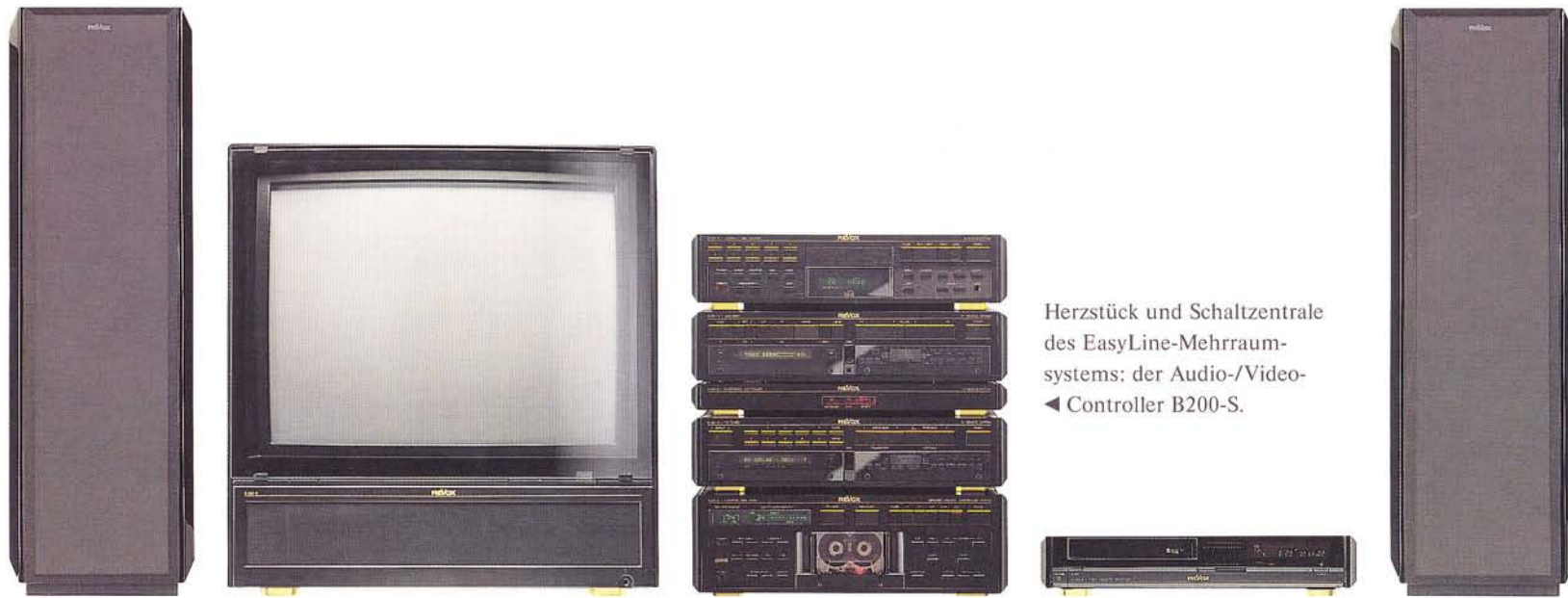
Herzstück und Schaltzentrale des EasyLine-Mehrraum- systems: der Audio-/Video- ◀ Controller B200-S.