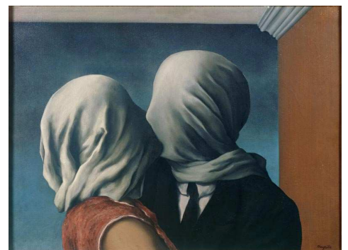
3) Les Amants [Die Liebenden], 1928