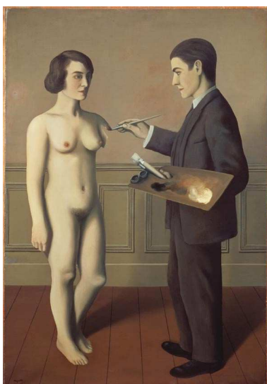
4) Tentative de l'impossible [Versuch des Unmöglichen], 1928