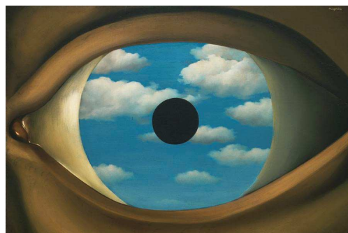
5) Le Faux Miroir [Der falsche Spiegel], 1929