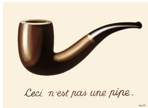
2) La Trahison des images [Der Verrat der Bilder], 1929