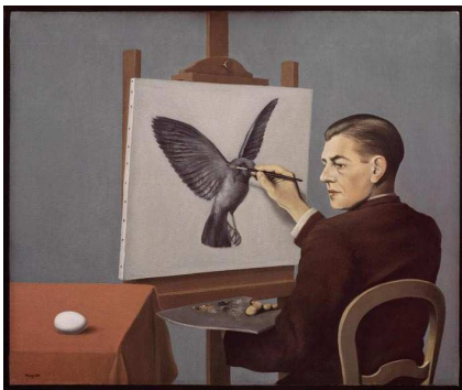
1) La Clairvoyance [Hellsehen], 1936