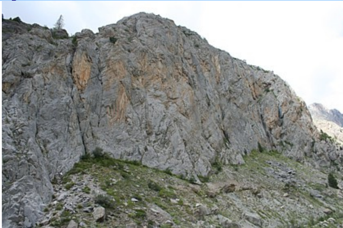
Der rechte Wandbereich des Klettergarten Pont Voûté