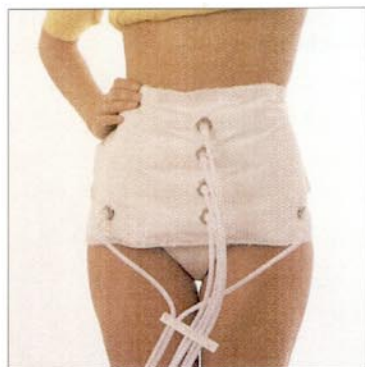
Stimulation of the small intestine and massage of the abdominal wall: specialities of the original Slide Styler. Dünndarmtonisierung und Bauchdeckenmassage: eine Besonderheit des original Slide Styler.

Weyergans High Care AG An Gut Boisdorf 8 · D-52355 Dueren Tel. +49-(0)24 21-9678-0 Fax +49-(0)24 21-9678-20 info@high-care.de · www.weyergans.com