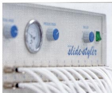
Up to 26 air chambers can be powered at the same time. The pneumatic control automatically finds the right treatment pressure.