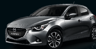
GRAPHITGRAU METALLIC (42A)