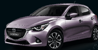
METISVIOLETT METALLIC (44R)