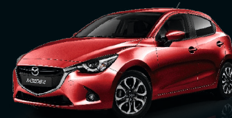
RUBINROT METALLIC (41V) SONDERFARBE