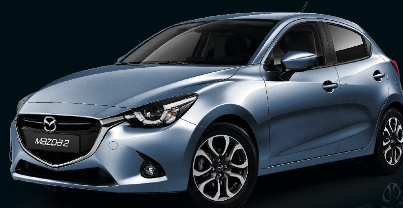
SAPHIRBLAU METALLIC (42B)

Gleich 11 ausgesuchte Farben stehen Ihnen zur Auswahl - von eher entspannt-dezenten Tönen bis hin zu selbstbewusst-lauten Varianten.