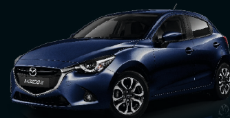
MITTERNACHTSBLAU METALLIC (42M)