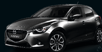
ONYXSCHWARZ METALLIC (41W)