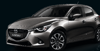
OBSIDIANGRAU METALLIC (42S)