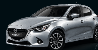
PLUTOSSILBER METALLIC (38P)