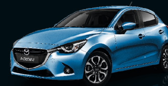
CYANITBLAU METALLIC (44J)