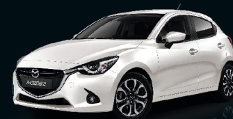
SATINWEISS METALLIC (25D)