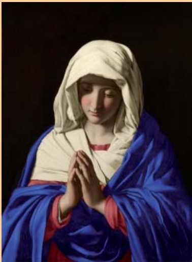
La Verge pregant, G. B. "Sassoferrato" (1640-1650)

Abans, però, cadascun dels seus membres haurà d'aprendre a obtenir la pau en aquest seu cor. Posada aquesta base, podrà anar construint-la sobre els pilars de la veritat, la llibertat, la justícia i l'amor. Però no podrà prescindir dels orígens de la salvació, en què uns éssers personifiquen la pau. Cal alegrar-se –i molt més en la celebració litúrgica del misteri de Nadal i en l'inici de l'any civil– d'aquests orígens. Alegria feta contemplació i pregària, que transformarà el nostre món que "Déu ha estimat tant fins a donar el seu Fill únic", "nascut d'una dona" que amb la seva fidelitat ha permès als creients de comprendre millor la pròpia condició de fills de Déu.