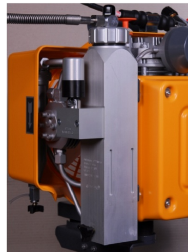
Filtersystem P 11