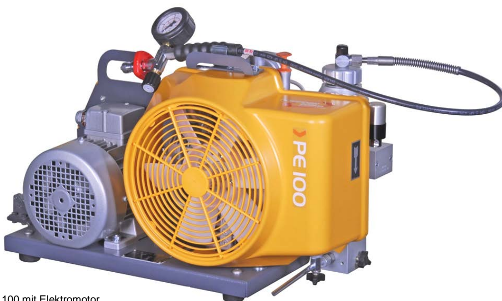
PE 100 mit Elektromotor