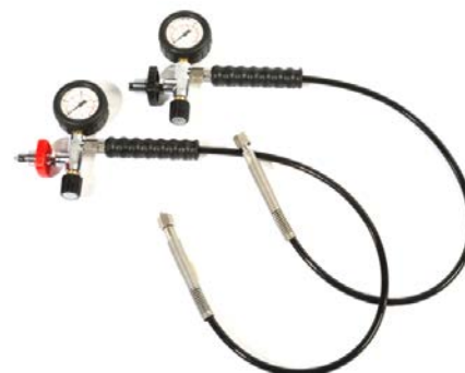
Fülleinrichtung PN200 bzw. PN300