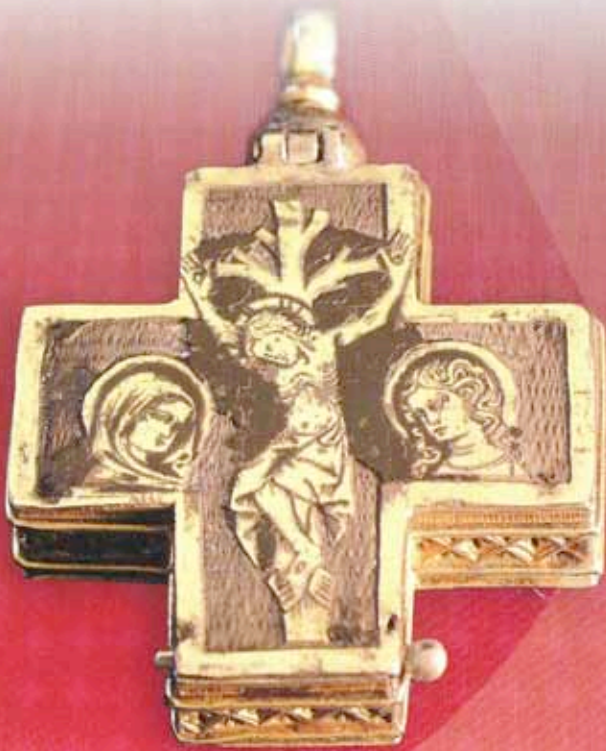
Titel Ulrichskreuz, Ulrichsgrab mit Grabplatte