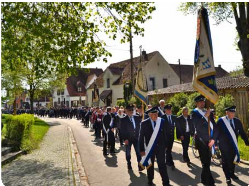
Zum 108. Mal ziehen die Pilger zur Männer- und Soldatenwallfahrt in die Wallfahrtskirche St. Michael in Violau ein.