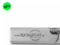
Gas Feuerzeuge, silber, 5Stk. 11,99 €