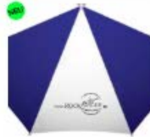
Automatik Stockschild 21,99 €