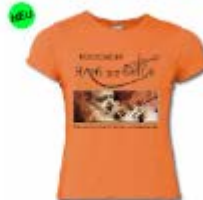
Girlseshirt 21,99 €