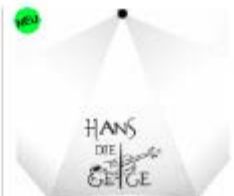
Taschenschirm 13,99 €