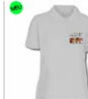
Polo Frauen 29,99 €