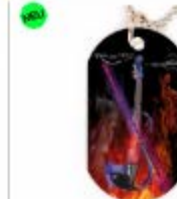
Dog Tag 9,99 €