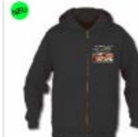
Hoody 39,99 €