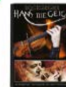
Notizbuch 29,99 €