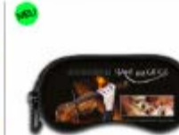
Brillenetui 14,99 €