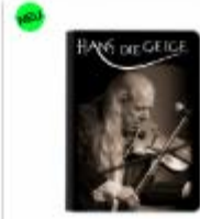
eReader & Tablet-Hülle 39,99 €