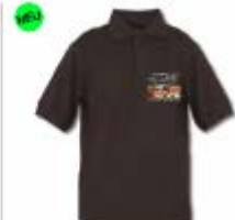
Polo Männer 29,99 €

Sicher einkaufen mit Geld-zurück-Garantie!