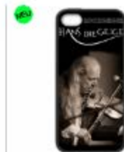
Smart-Case iPhone 5/5s/5c 19,99 €