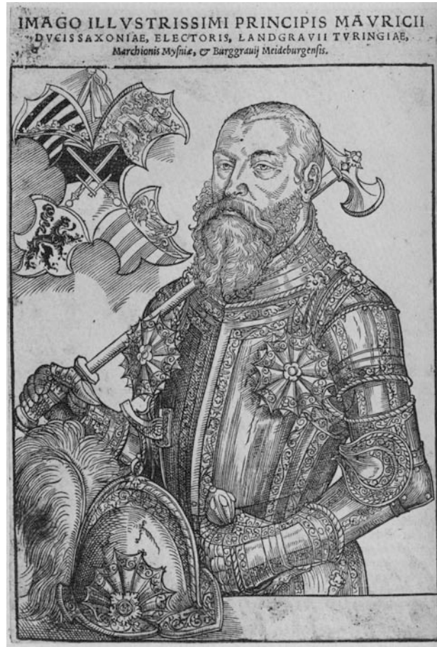
Moritz von Sachsen (1521-1553): Anführer der Fürstenopposition gegen Karl V.

In langwierigen Verhandlungen kam ein umfassendes Vertragswerk zustande, das die folgenden Jahrzehnte sehr viel stärker prägen sollte als es die Beteiligten vermutlich selbst geglaubt hatten; die nachfolgenden Historikergenerationen haben den eigenständigen Charakter des Friedens von 1555 unterschiedlich bewertet.