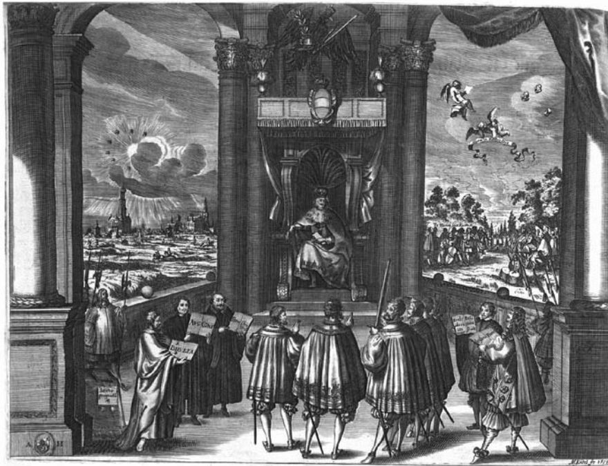
Friedensgemälde zum 100-jährigen Jubiläum des Augsburger Religionsfriedens. Reichsfürsten und Vertreter der Konfessionen vor dem kaiserlichen Thron. Kupferstich 1655.