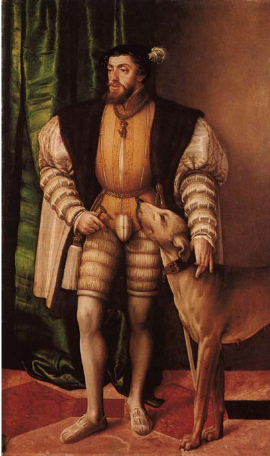
Karl V. (1500-1558)