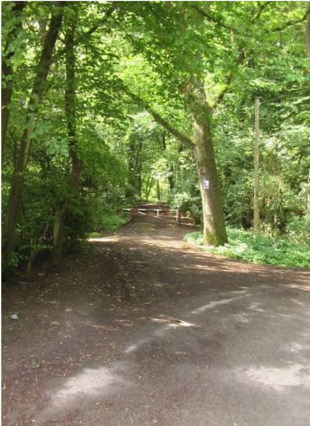
Die asphaltierte Fahrstraße verlassen wir an der Rechtskurve und passieren die Schranke im Wald.