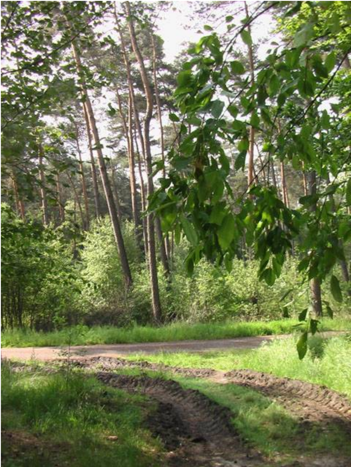
Punkt 3, weiter links

Nach ca. 4 Minuten endet die Forststraße an der Arsbecker Bahn, Pkt. 4, ebenfalls eine befestigte Forststraße, die Wildenrath und Birgeln verbindet.