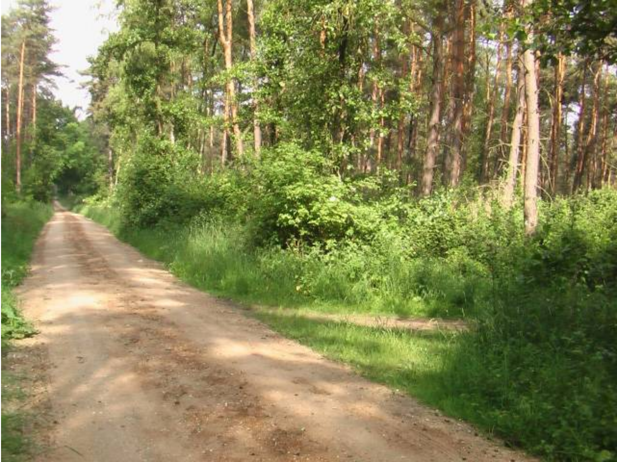
Abzweig Punkt 8