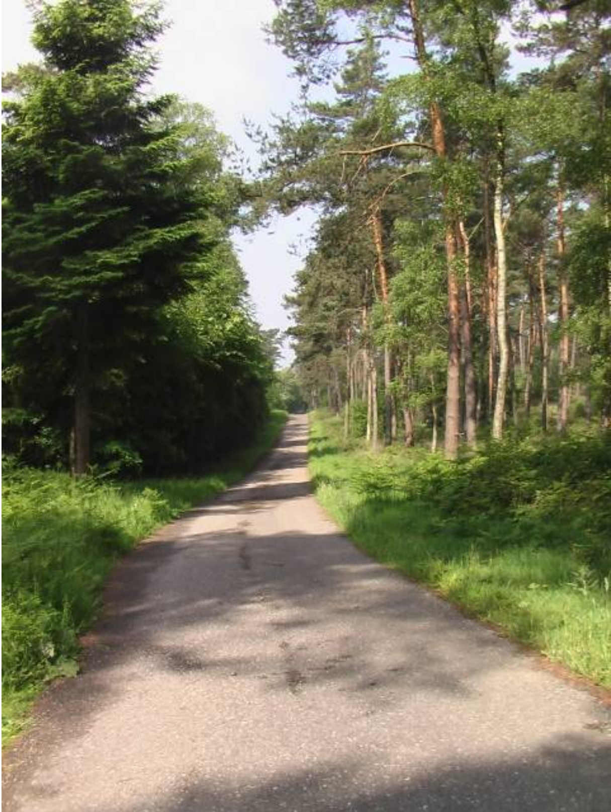
Weiter geradeaus. Die asphaltierte Forststraße wurde 1972 allein zum Zweck der Zufahrt zum Wetterschacht der Zeche Sophia Jacoba befestigt.