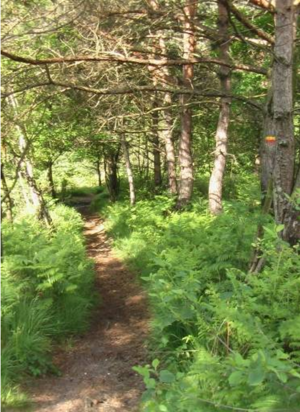
Der Weg führt hinunter zum Schaagbach.