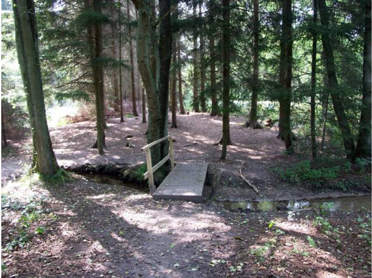
Der Steg über den Schaagbach führt in den dichten Fichtenwald.