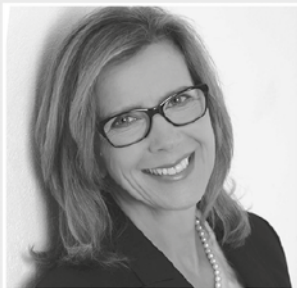
MARTINA WESSELING IMMOBILIEN

Die Jagdgenossenschaft Farrach lädt am Sonntag, 11. März, zur Jahreshauptversammlung beim Neuwirt in Rettenbach ein. Beginn ist um 20 Uhr.