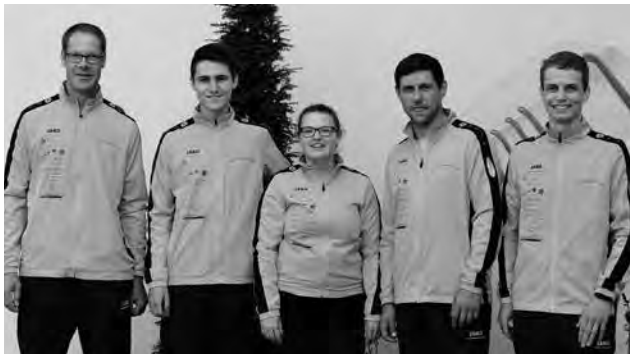
Auf unserem Foto die erfolgreiche Bundesliga-Mannschaft

Die Schützen lieferten einen sehr guten Rundenwettkampf ab. Besonders war der letzte Wettkampftag, an dem die Mannschaft sowohl den SV Hubertus Hitzhofen, als auch den SG Raisting mit je 3 : 2 Punkten besiegen konnte.