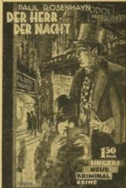
Der Herr der Nacht Band 1