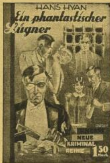
Ein phantastischer Lügner Band 2