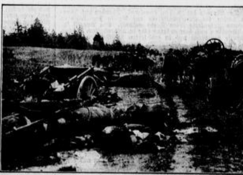
Rechte: Hier hat unsere Artillerie ganze Arbeit geleistet. Ein eindrucksvolles Bild von einer sowjetischen Rückzugsstraße, die unter dem wohlgezielten Feuer unserer Artillerie gelegen hat.