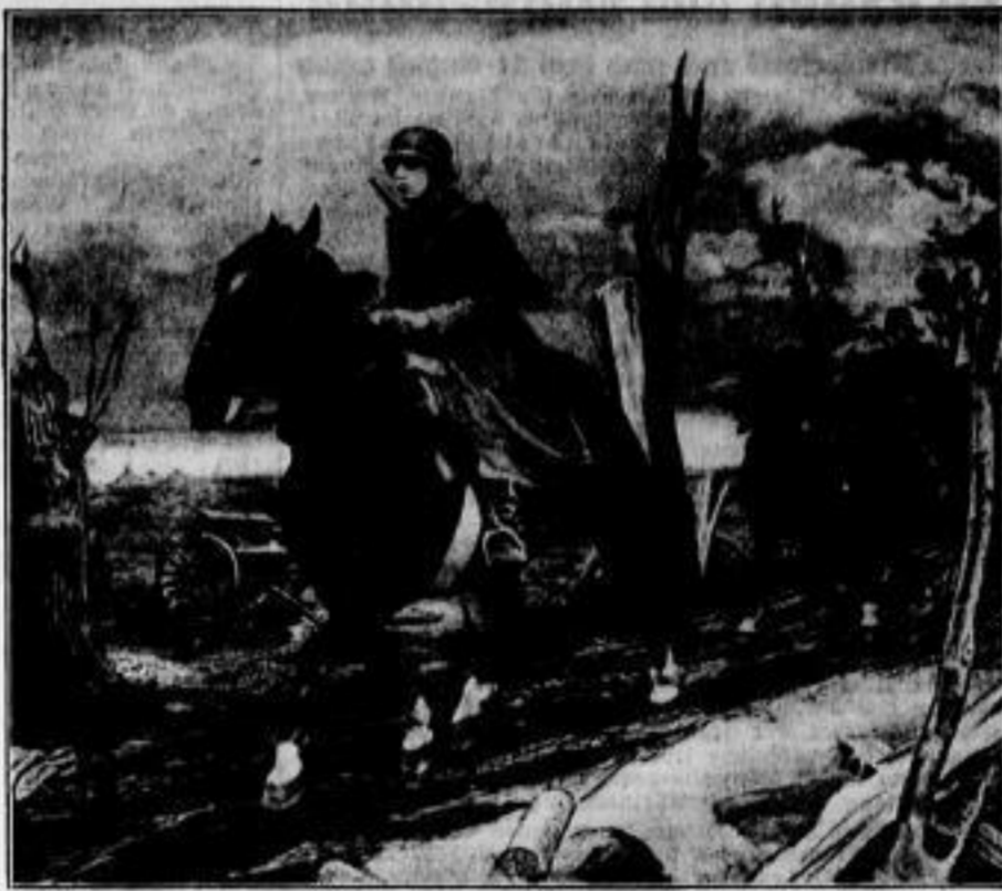
'Flandern', Gemälde von Oskar Martin-Amorbach Aus der Großen Deutschen Kunstausstellung in München