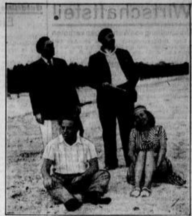
Priv.-Aufnahme Drei Dresdner grüßen aus Joppo

Verdunkelung Beginn: 2. August 20.30 Uhr Ende: 4. August 4.23 Uhr