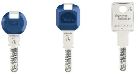
Standardschlüssel (Clip in schwarz)