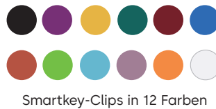
Smartkey-Clips in 12 Farben