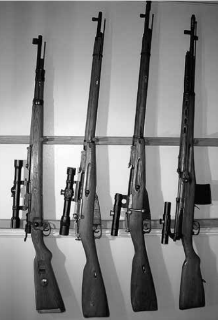
Einige Scharfschützenwaffen des Zweiten Weltkrieges; von links nach rechts: K 98k mit Zielfernrohr (ZF) Zeiss „Zielvier“, Mosin-Nagant mit ZF 4-fach PE, Mosin-Nagant mit ZF 3,5-fach PU, Tokarew-Halbbauautomat mit ZF 3,5-fach PU. (Fa. Transarms, Worms)

Bei den Abwehrkämpfen in der Normandie 1944 sollen deutsche Scharfschützen in größerem Umfang auch K 98k mit Schalldämpfer eingesetzt haben.