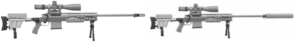
Haenel RS 9 im Farbton RAL 8000 ohne und mit Schalldämpfer.

ster Magnum (WinMag) der Firma Accuracy International. So war die Reichweite gegeben, das theoretische Rüstzeug holte man sich bei NATO-Partnern. Bei der Bundeswehr dauert manches halt länger, wird dann aber oft dreimal so gut. Das erwies sich bei der Scharfschützenausbildung, besonders beim Kommando Spezialkräfte (KSK).