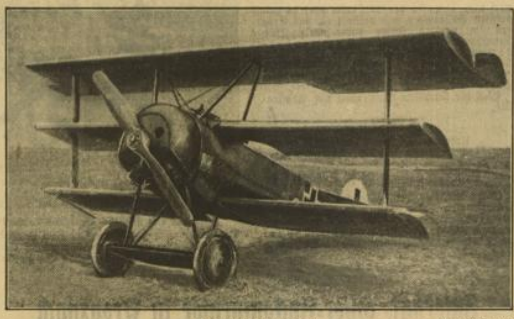
Richthofens Dreiecker Archivbild (2)

Boelcke entdeckte den Piloten Im Sommer des nächsten Jahres wird er als Flugzeugbeobachter beim Vormarsch auf Breslau eingesetzt. Am 1. September 1915 befehlt er den ersten Luftkampf. Er lernt den berühmten Rittmeister Boelcke kennen. „Lassen Sie sich als Pilot ausbilden“, sagt dieser zu seinem Kameraden. Und Richthofen, der wenige Tage später zum ersten Alleinflug startet, kann schon im Dezember den Eltern als Weihnachtsgeschenk sein bescheidenes Pilotenzeugnis melden. Im Frühjahr 1916 stellen sich in Frankreich die ersten Erfolge ein. Dem jungen Flieger wird das Eisene Kreuz 1. Klasse verlie-