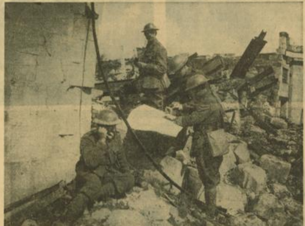
Bei den Engländern an der Westfront Englischer Artillerie-Beobachtungsstand hat sich in den Trümmern eines zerschossenen Hauses eingerichtet.

hört man schon im Winter 1914/15 auf englischer Seite Truppenlager angelegt, besonders für Englands farbige Hilfstruppen, so war man bereits bei den Vorbereitungen, eine Landungsarmee für die Dardanellen zu bilden. So kamen auch die ungezählten Tausende Dardanellenangreifer, wie aus einem unerschöpflichen Quell aus dem ägyptischen Raum. Hier hatten sie Ausbildung, Ruhe und pflegten später ihre Wunden, die sie sich in monatelangem, erfolglosen Anrennen geholt hatten. Ägypten war