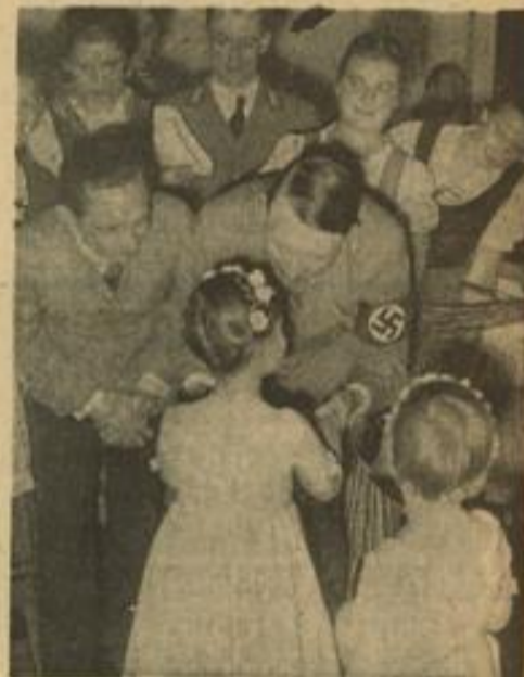
Aufn. Bildarchiv (10)