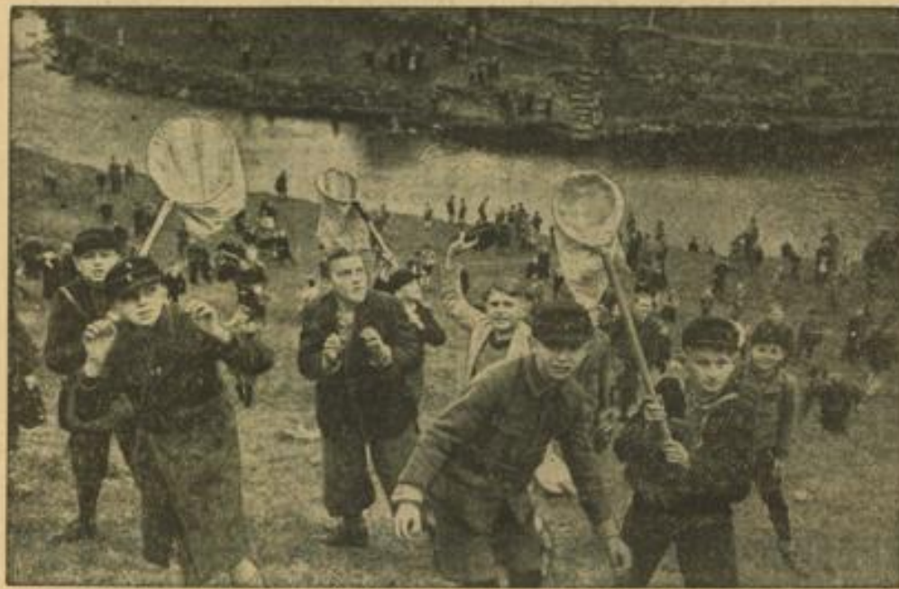
Jagd auf Ostereiern