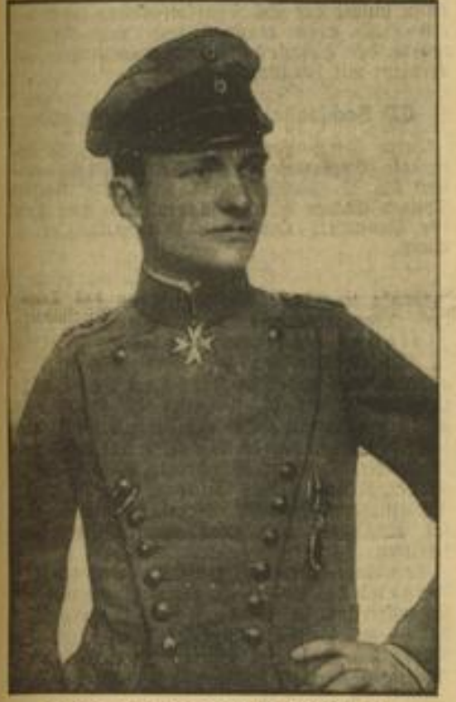
Manfred Freiherr von Richthofen † deutscher Kampfflieger