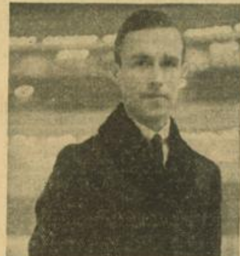
Gillis Grafström gestorben. Der frühere mehrfache Weltmeister und zweimalige Olympiasieger im Eiskunstlaufen (1924 und 1928), der Schwede Gillis Grafström, ist im 48. Lebensjahr in Potsdam gestorben.

Aber neben den Jungen werden für einige Zeit noch die etprobieren Alten stehen. Zu die-