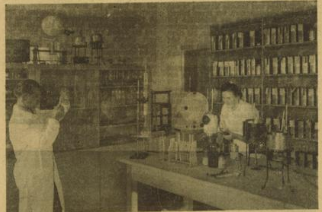
In einem Mannheimer Laboratorium für Mineralogie

Die Aussichten für Donnerstag: Bedecktes bewölkt und regnig mit weiteren Niederschlägen, Temperaturen wenig geändert, Winde aus Süd bis West.