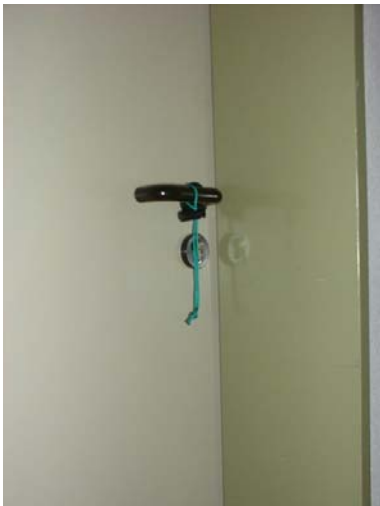
Dieser Raum wurde einmal durchsucht. Es befinden sich keine Personen mehr darin.

Anbei wiederum zwei Kennzeichnungsbeispiele: