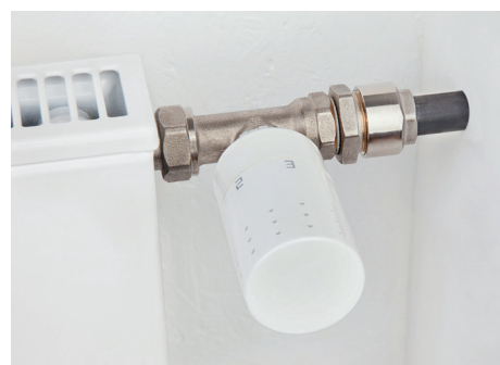
Einsatz in Heizungsanlagen mit DIN-Stahlrohr (Schwarzrohr)