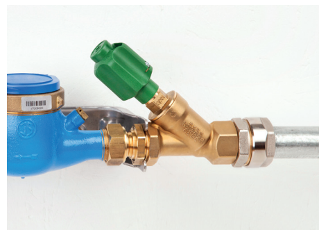
Einsatz in Trinkwasseranlagen* mit verzinktem DIN-Stahlrohr

mit Innengewinde F13090 Rohr 3/8" x G1/2i F13091 Rohr 1/2" x G1/2i F13092 Rohr 3/4" x G3/4i F13093 Rohr 1" x G1i F13094 Rohr 1 1/4" x G1 1/4i