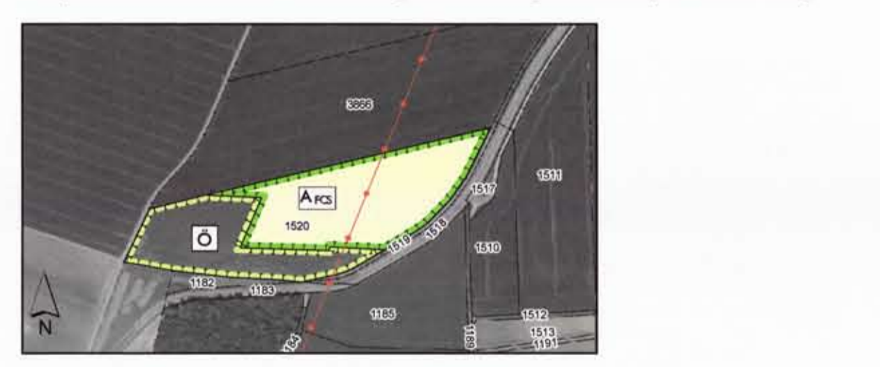
Übersichtskarte Ausgleichsfläche "Feldhamster" Kompensationsmaßnahme zur Wahrung des Erhaltungszustandes (FCS Maßnahme)