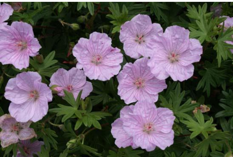
Geranium sanguineum striatum

Een witte Geranium voor in de schaduw. Alle perfecties als de gewone G. nodosum én zaaft amper uit.