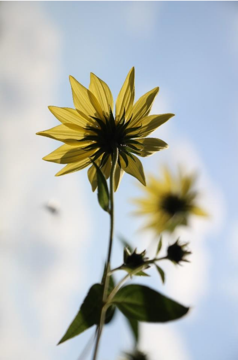
Helianthus 'Sheila's Sunshine'

donkerkleurige Asters. Deze Helianthus is sterkgroeïend, maar blijft in een toef. Help de plant door om de drie jaar eens te scheuren. Goede snijbloem!