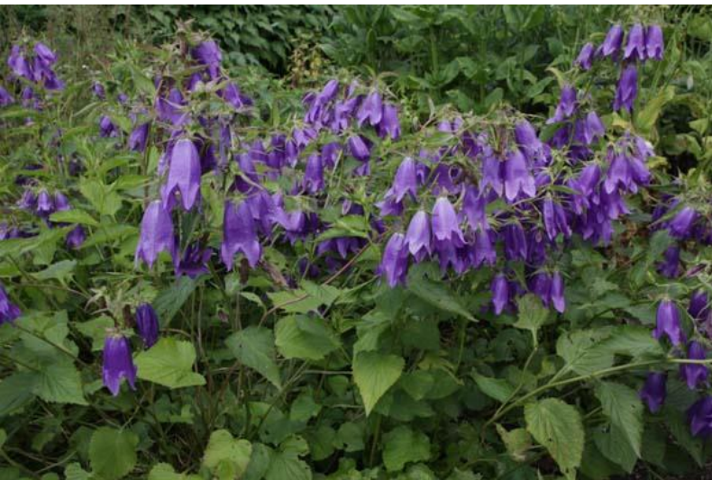
Campanula 'Kent Belle'

25 cm | lila | juni – september | ☞ 9 | ☀️