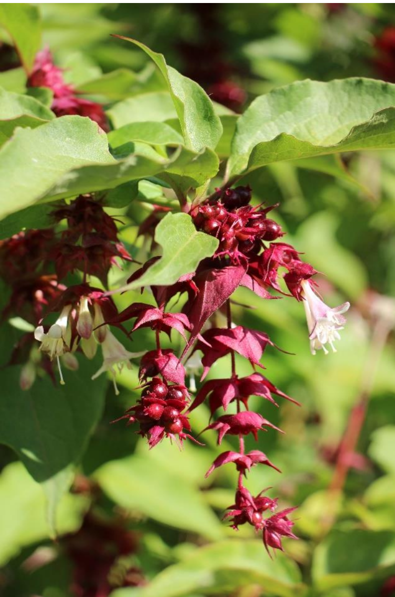
Leycesteria 'Purple Rain'

Halfheester met een eerder Cornus -achtige groeiwijze en blad. Aan de eenjarige stengels komen grote bloemtrossen met bordeauxrode schutbladeren en witroze bloempjes, die vervolgens overgaan in purperrode bessen. Durft wat in te vriezen. Knip de plant gerust stevig terug. Een paar bloeiende takken in een vaas geeft een prachtig boeket.