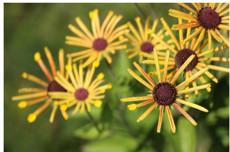
Rudbeckia subtomentosa 'Henry Eilers'

Wintergroen kruid met naaldachtig blad die vooral opgaan groeit. Deze selectie is bij uitstek geschikt voor culinaire toepassingen. Niet altijd winterhard, dus zet Rozemarijn beschut uit de schrale oostenwind. Doet het bij ons al enkele winters, al kon je het bezwaarlijk winters noemen.