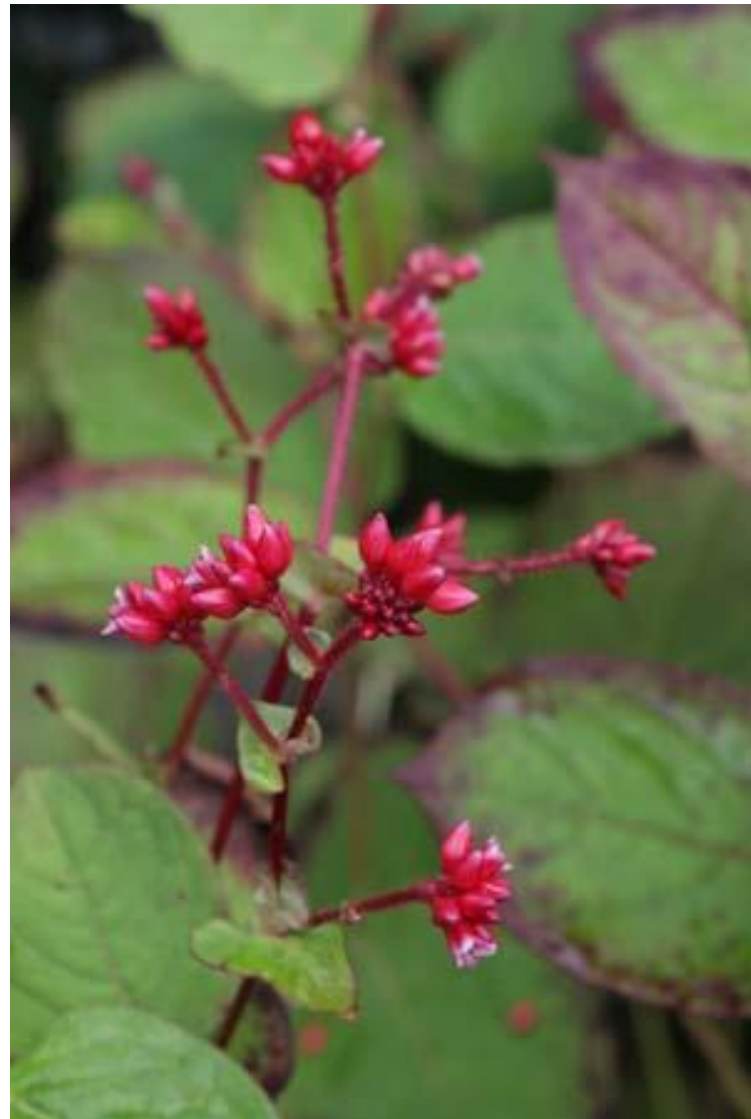
Persicaria 'Indian Summer'

Oranjeroodkleurige fuchsia-achtige buisbloemen hangen in trossen aan luchtig vertakte stengels. Perfect winterhard.