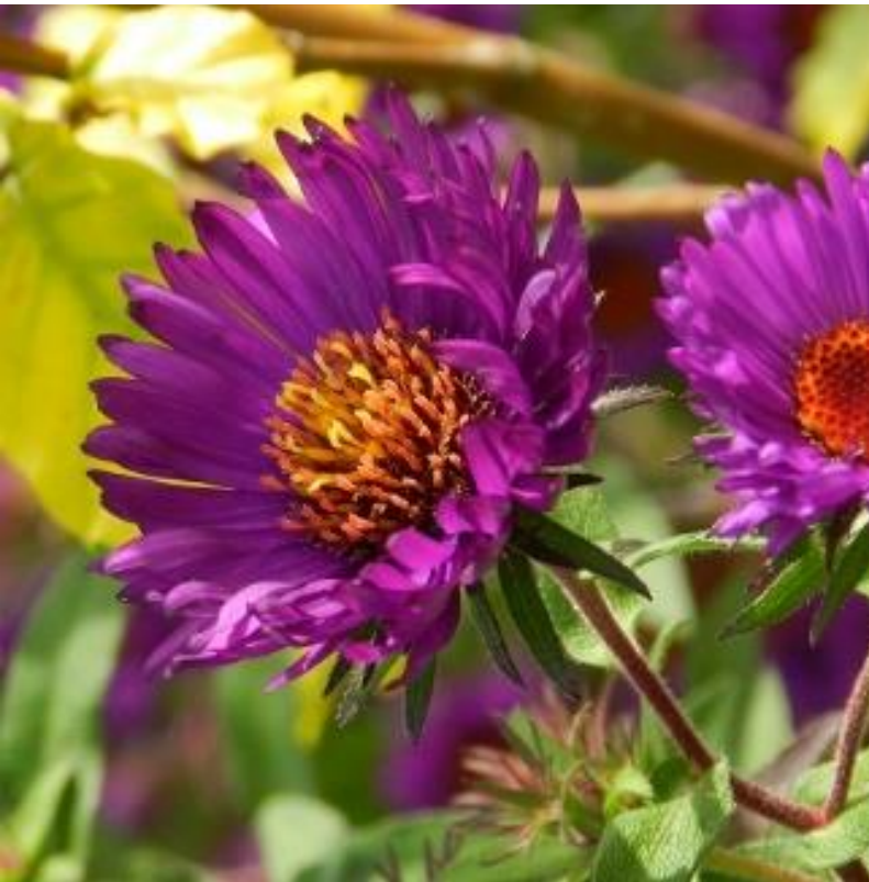
Aster novae-angliae 'Deep Purple'

bladsteeltjes zijn bedekt met tegenovergesteld staande wintergroen blaadjes. Steenbeekvaren houdt van een beetje kalk.