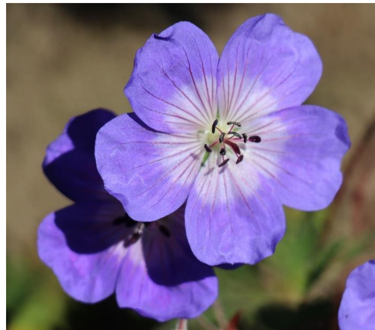
Geranium 'Azure Rush'

Het allroundergeslacht bij uitstek. Geraniums vind je voor elke plek in de tuin; droog of nat, zon of schaduw. Het aanbod is groot, wij beperken ons tot enkele soorten en cultivars die zich reeds hebben onderscheiden.