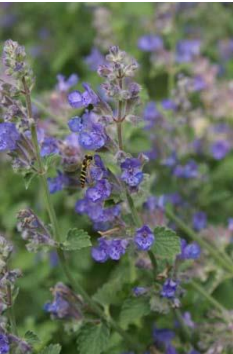
Nepeta 'Kit Cat'

Een compacte, kleinbladige, lage vorm met rijke bloei van dieppaarsblauwe bloemen. Ideaal om vooraan in de border te plaatsen of onder wat hogere planten.