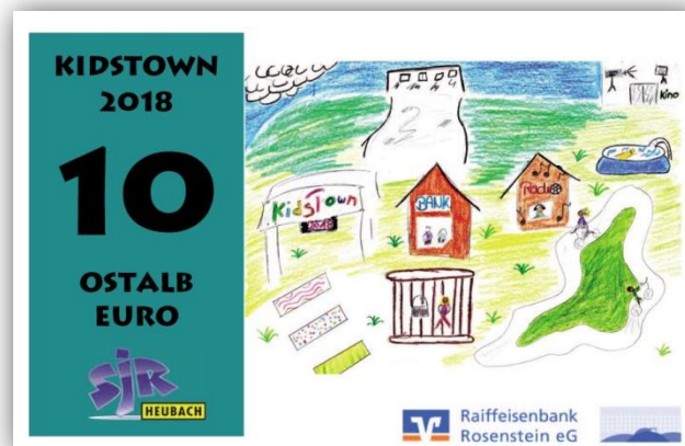
Geldschein mit einem der Gewinnerbilder von Kidstown 2018

Sehr wichtig: Es können nur Bilder berücksichtigt werden, die in Querformat gestaltet werden. Eine unabhängige Jury sucht die sechs schönsten Bilder aus und teilt die Gewinnerbilder den Geldwerten zu.