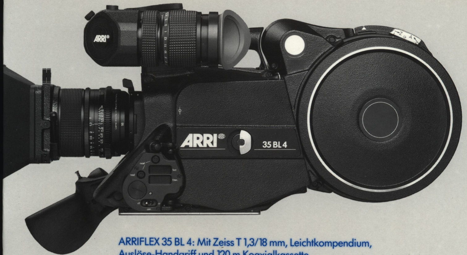
ARRIFLEX 35 BL 4: Mit Zeiss T 1,3/18 mm, Leichtkompodium, Auslöse-Handgriff und 120 m Koaxialkassette.