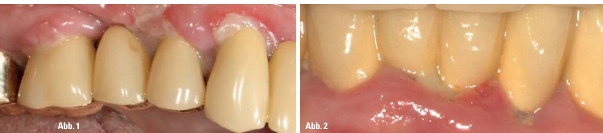
Abb. 1 und 2: Vergleich von Mundschleimhautveränderungen. – Abb. 1: Pemphigus vulgaris. – Abb. 2: Schwere Parodontitis mit ödematöser Gingiva.

an Jahren mit Tabakabusus ergibt die international anerkannte Kennzahl der „Pack Years“), da sie einen akkumulierenden Einfluss auf die parodontale Gesundheit nehmen.