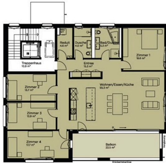
5.5-Zimmer-Wohnung BNF 161.3 m 2 22.03