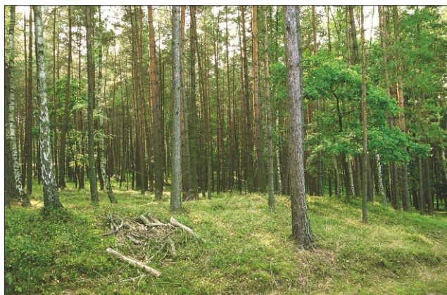
Typischer Kiefernwald mit Blaubeerfeldern und Birkensaum