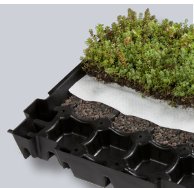
ND Sedumkassette - Premium

Drainageschicht: Durch spezielle und auf bestmögliche Wasserhaltung ausgelegte Drainageöffnungen in der Kassette kann überschüssiges Regenwasser direkt auf die wasserführende Ebene gelangen. Dadurch ist die Vegetation vor störender Staunässe geschützt.