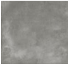
Fliese für Loggien/Balkone „Volcano Grey“