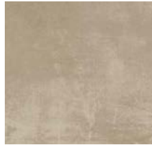
Fliese für Bäder/Toiletten „TAUPE“