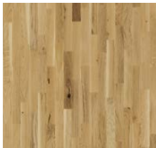
2-Schicht-Parkettboden „Eiche Business“