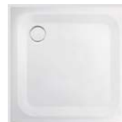
Brausetasse „Vigour Derby“, 90 x 90 cm mit ca. 3 cm Höhe über Fliesenbelag