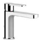
Einhand-Waschtischmischer „Gessi Corso Venezia“