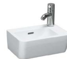
Handwaschbecken „Laufen Pro A“, 36 x 25 cm