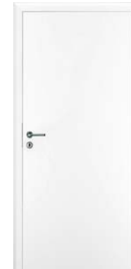
INNENTÜREN: Weiß lackierte Röhrenspan- Holztürblätter auf lackierten Stahlgargen