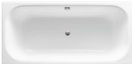
Badewanne „Vigour Derby“, Stahl-Email, 170 x 75 cm