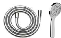
Brausegarnitur für Badewanne