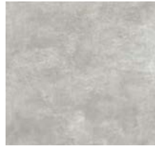
Fliese für Bäder/Toiletten „ASH“