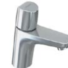
Standventil „Vigour Derby“ (nur Kaltwasser)