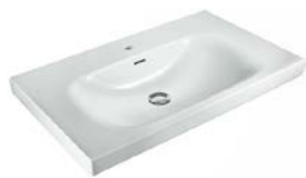
Möbelwaschtisch „Vigour Derby“, Keramik, 80 x 48 cm