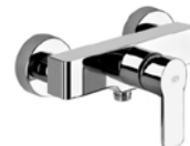
Einhand-Brausebatterie „Gessi Corso Venezia“