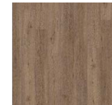
Vinyl-Boden „Brown Limed Oak V4“