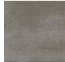
Fliese für Bäder/Toiletten „GREY“