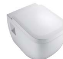
Wand-WC „Vigour Derby“, spülrandlos, WC-Sitz abnehmbar mit Absenkautomatik