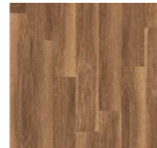
Vinyl-Boden „Classic Nut tree V4“