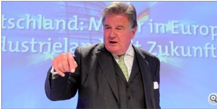
RWE-Vorstandsvorsitzender Großmann: Feste Ausstiegsdaten sind Populismus

Jürgen Großmann hat eine Rabatzrede gegen den Atomausstieg gehalten. Der RWE-Chef warnt vor einer Bedrohung des Wirtschaftsstandorts Deutschland - und der Demokratie. Gleichzeitig mehren sich Hinweise, dass die Brennelementesteuer vor dem Aus steht.