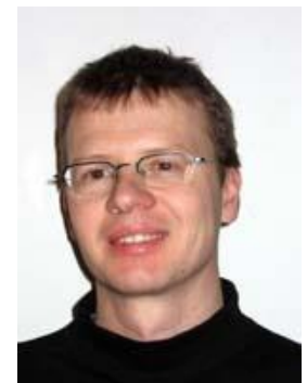
Umweltjournalist Bernhard Pötter

„Ob wir es wollen oder nicht, die Zukunft wird grün sein. Wir haben die Wahl: Entweder in Ressourcenkonflikte und „Ökodiktatur“ zu stolpern – oder unsere Demokratie zur Ökokratie umzubauen.“(15)