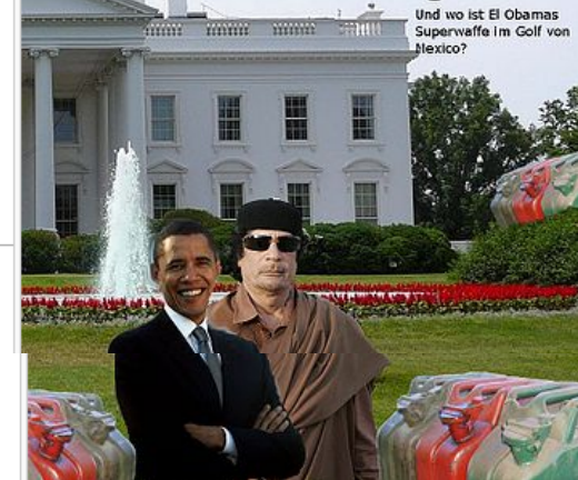
Die beiden Weltgrößten Öko-Diktatoren trafen sich dieses Jahr in Washington

Und wo ist El Obamas Superwaffe im Golf von Mexico?