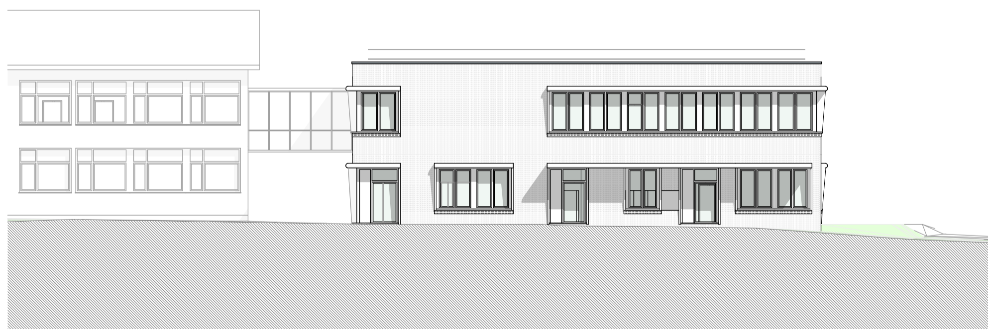
A-04 | Ansicht West M 1:200