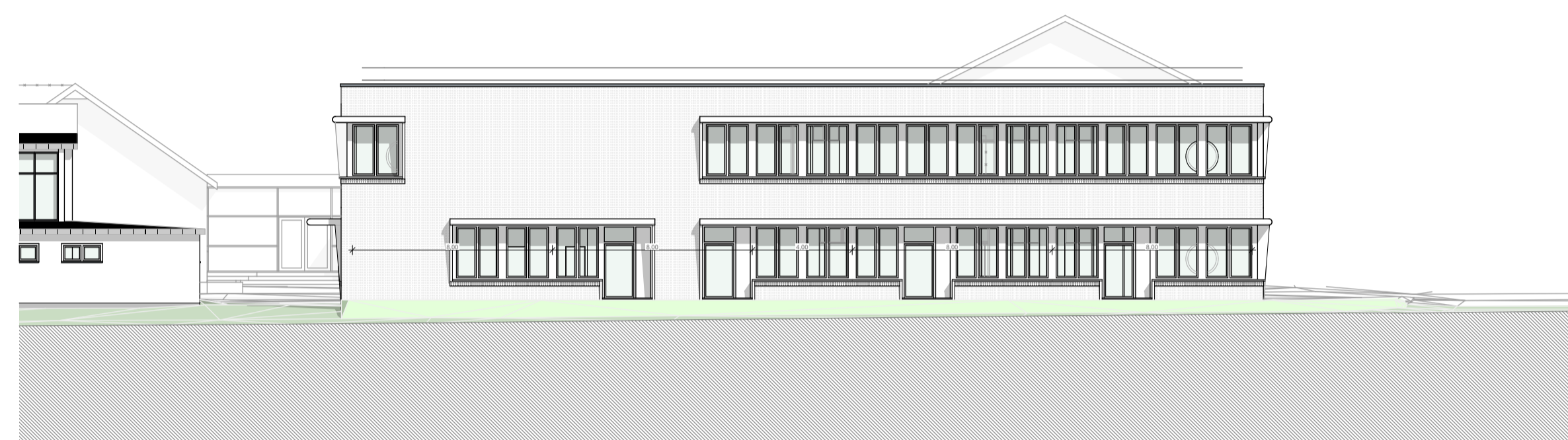
A-01 | Ansicht Süd M 1:200