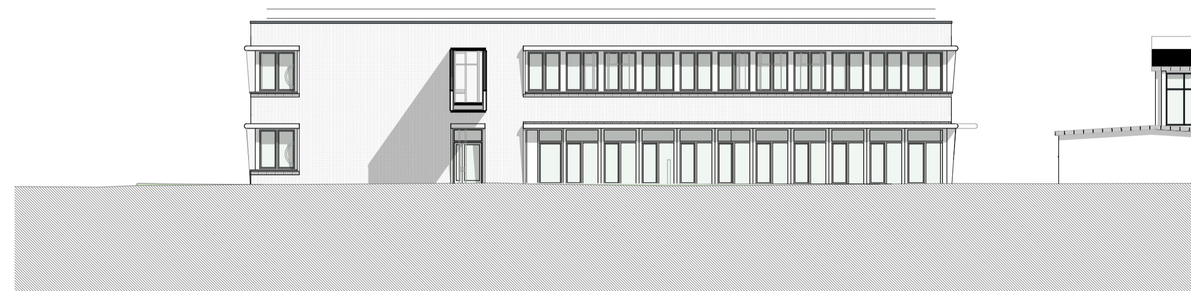
A-03 | Ansicht Nord M 1:200