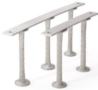
Abbildung 1: Durchstanz- bzw. Schubbewehrung JDA in gerippter Ausführung

JORDAHL Durchstanz- bzw. Schubbewehrungen werden bemessen nach: