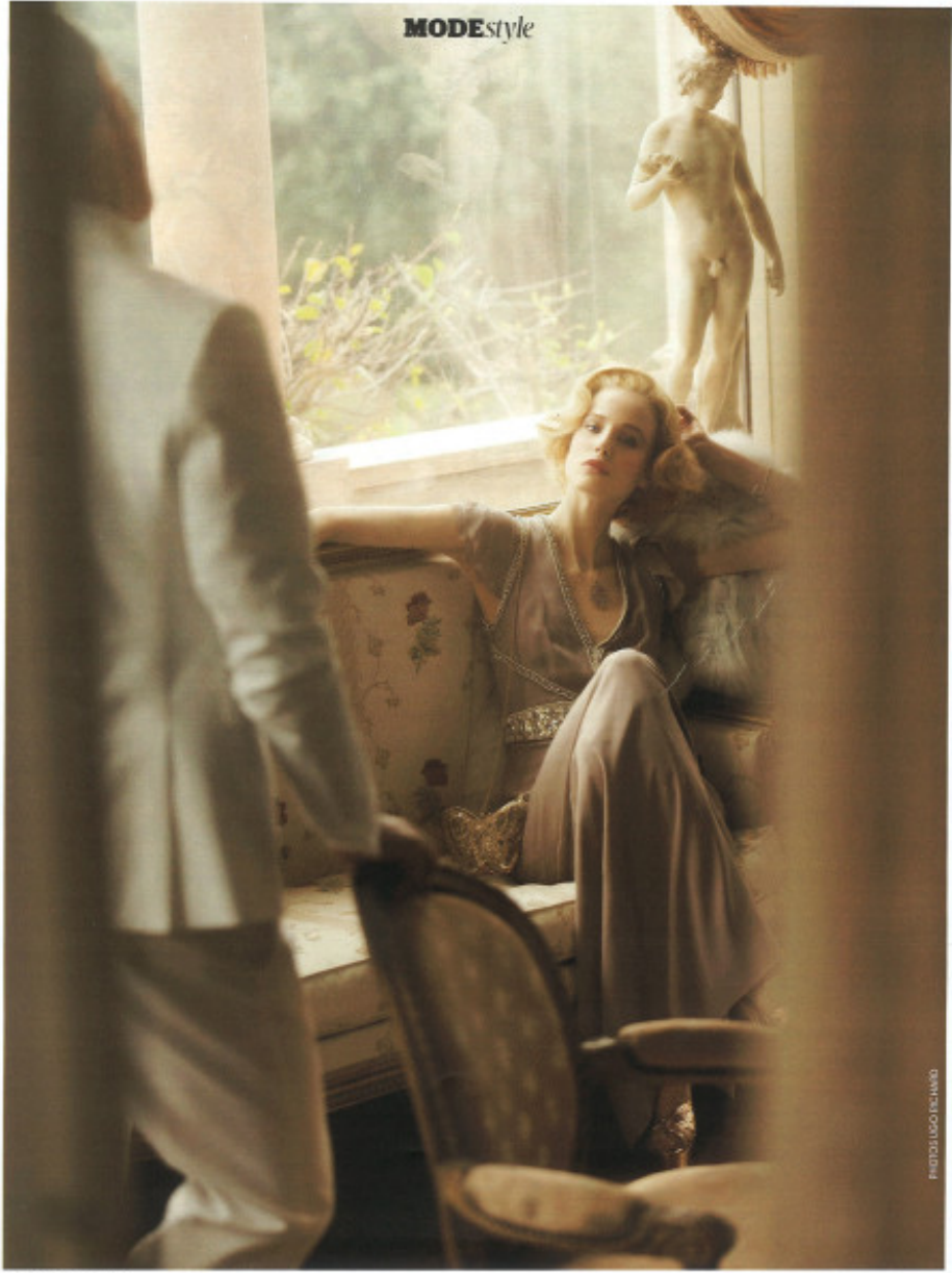
B6 / madameERGARIO