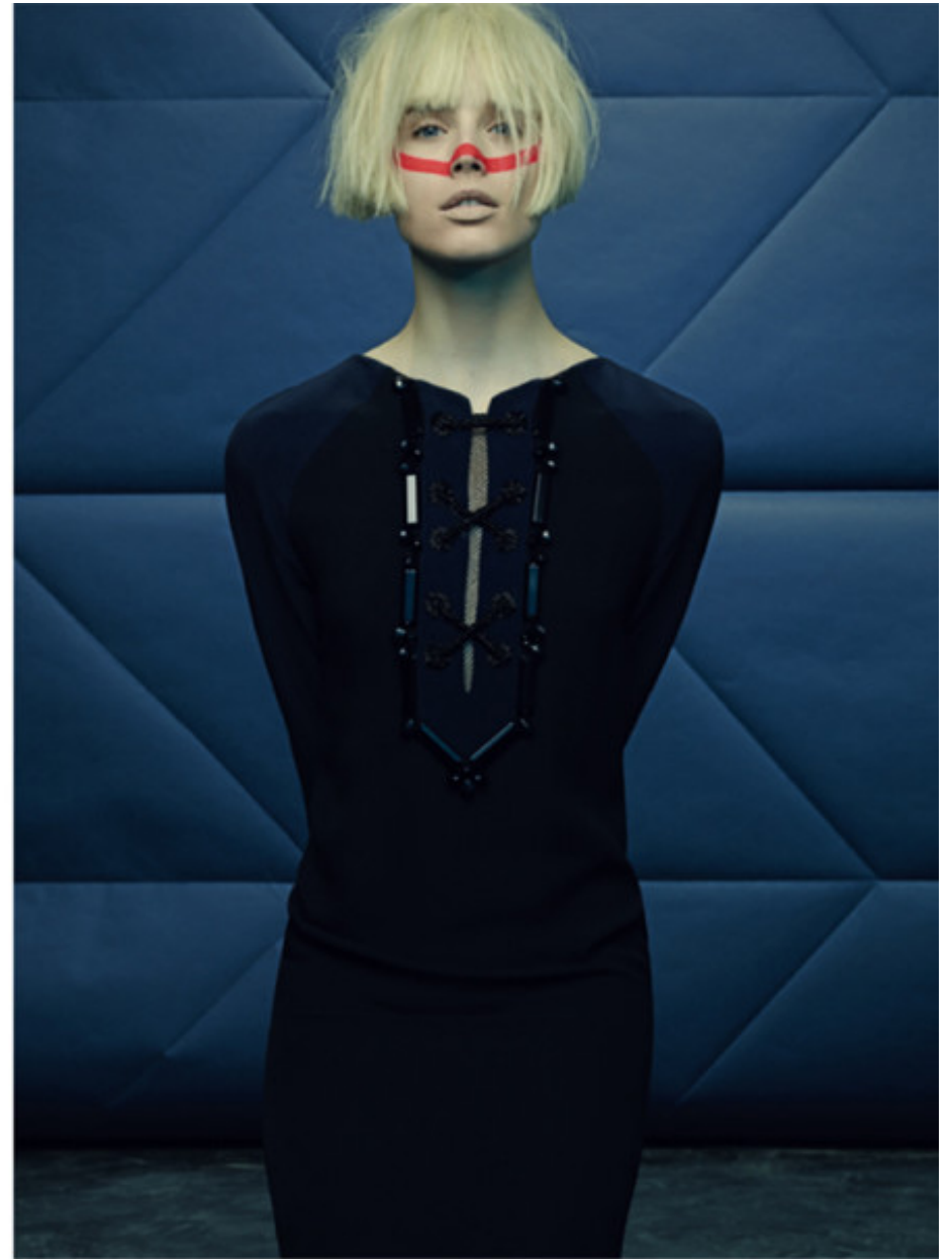
Beaded dress, LOUIS VUITTON