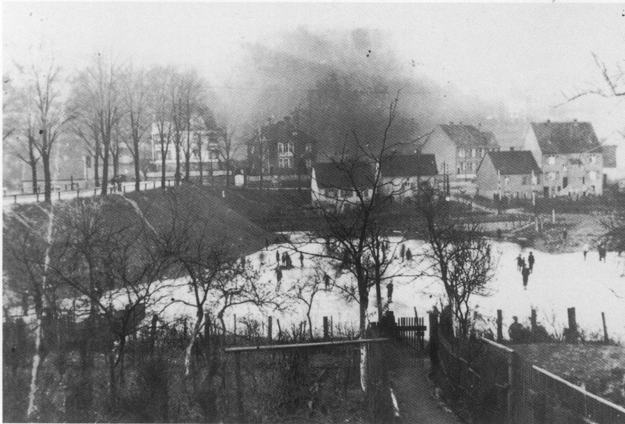
Aufnahme – Winter 1931/32 Das untere Wiesental ist überschwemmt und von Januar bis März als Eisbahn von der Scheidter Jugend genutzt.