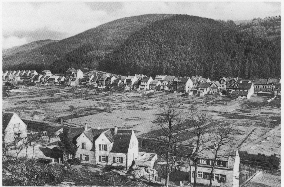
Aufnahme um 1960 Blick nach Osten zum Scheidterberg und Stiefel hin. Zwischen Kaiserstraße (im Hintergrund) und Friedhofsweg (vorne) liegen die rd. 200 m breiten alten Talwiesen.