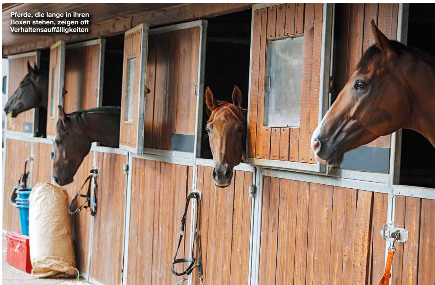
Pferde, die lange in ihren Boxen stehen, zeigen oft Verhaltensauffälligkeiten