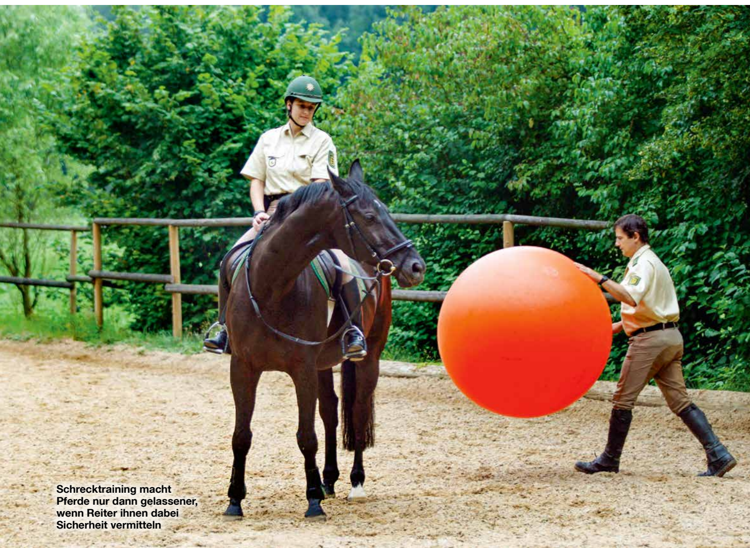
Schrecktraining macht Pferde nur dann gelassener, wenn Reiter ihnen dabei Sicherheit vermitteln

Lager zum Hinlegen anregt, den Gliedmaßen Schutz vor Verletzungen gewährt und eine Wärmedämmung zwischen dem warmen Körper und dem kalten Boden schafft. „Um dem Pferd das Bedürfnis nach Ruhe zu gewähren, ist gleichzeitig auch das Komfortverhalten des Pferdes zu »