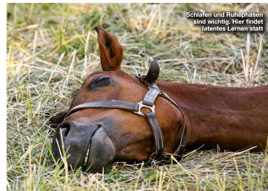
Schlafen und Ruhephasen sind wichtig. Hier findet latentes Lernen statt