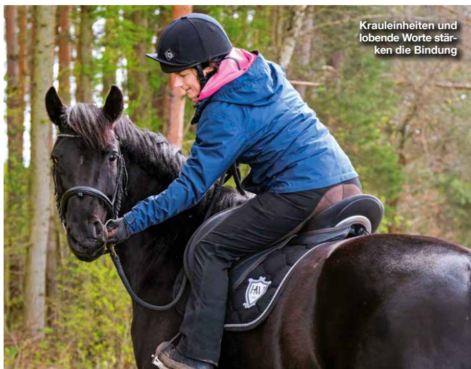
Krauleinheiten und lobende Worte stärken die Bindung