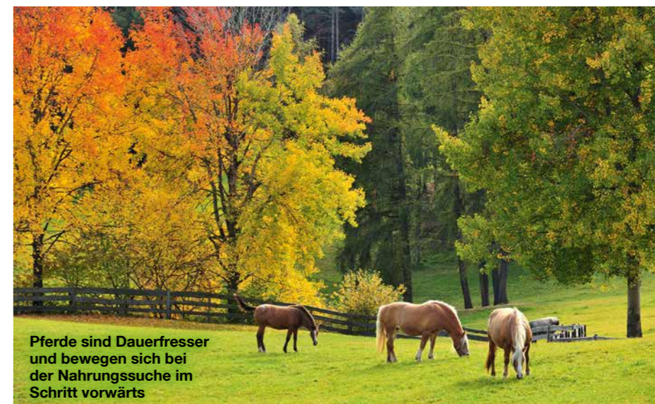
Pferde sind Dauerfresser und bewegen sich bei der Nahrungssuche im Schritt vorwärts

Das Ruhen ist wichtig für die Vierbeiner, denn neben der Nahrungsaufnahme verbringen sie damit die meiste Zeit des Tages. Dies geschieht in mehreren kurzen Schlaf- einheiten über den Tag verteilt (etwa zwischen fünf und neun Stunden bei erwachsenen Tieren). Das Ruhen wird unterteilt in Dösen und Tiefschlafphasen. „Beim Dösen verbringen sie die Ruhepause im Stehen und entlasten oft ein Hinterbein. Dieser Wach-/ Schlafzustand nimmt 80 Prozent des Ruhe- verhaltens ein“, erklärt die Pferdetrainerin. Der tatsächliche Tiefschlaf wird in Seitenlage abgehalten und ist wichtig für die psychische Regeneration. „Pferde ruhen nur im Liegen, wenn sie sich sicher fühlen. Als Fluchttiere müssen sie zu jeder Zeit die komplette Umgebung im Blick haben oder einen Artgenossen in ihrer Nähe, der Wache hält.“ Einfluss auf das Ruheverhalten haben neben dem Rang auch die Witterung, die Haltungsform,