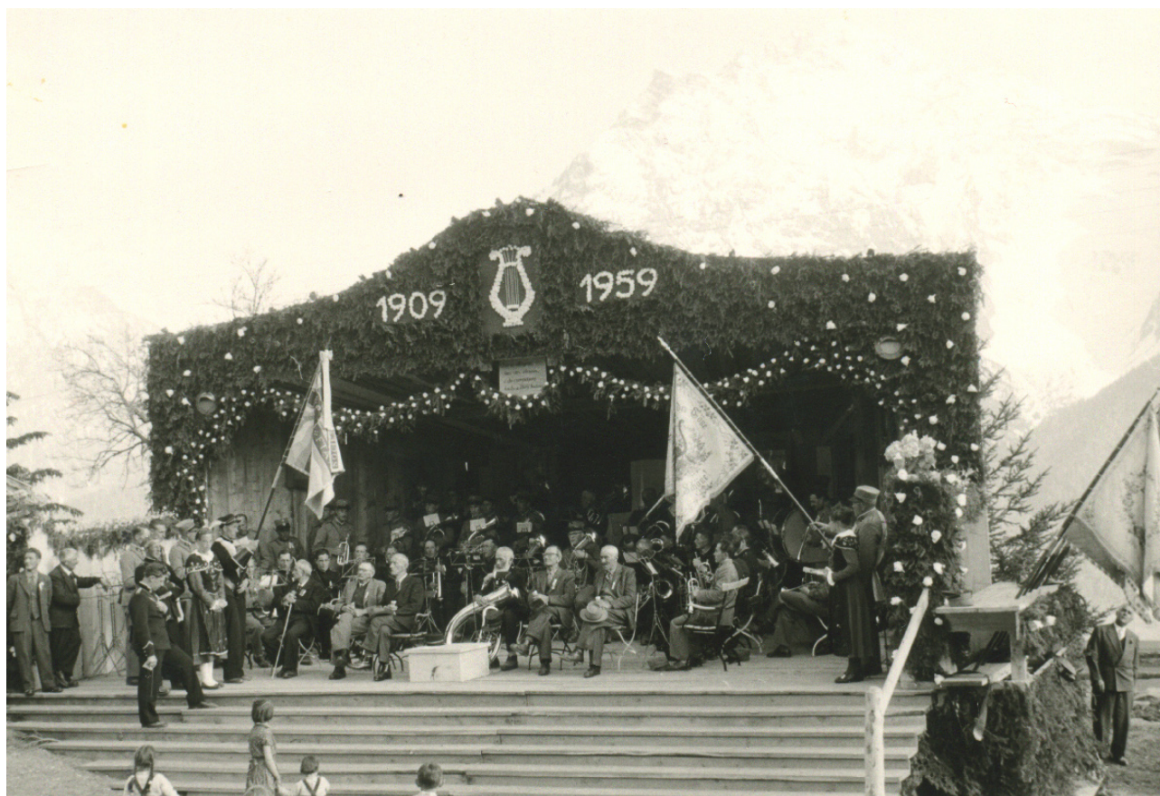
Giubileum 50 ons, l'on 1959