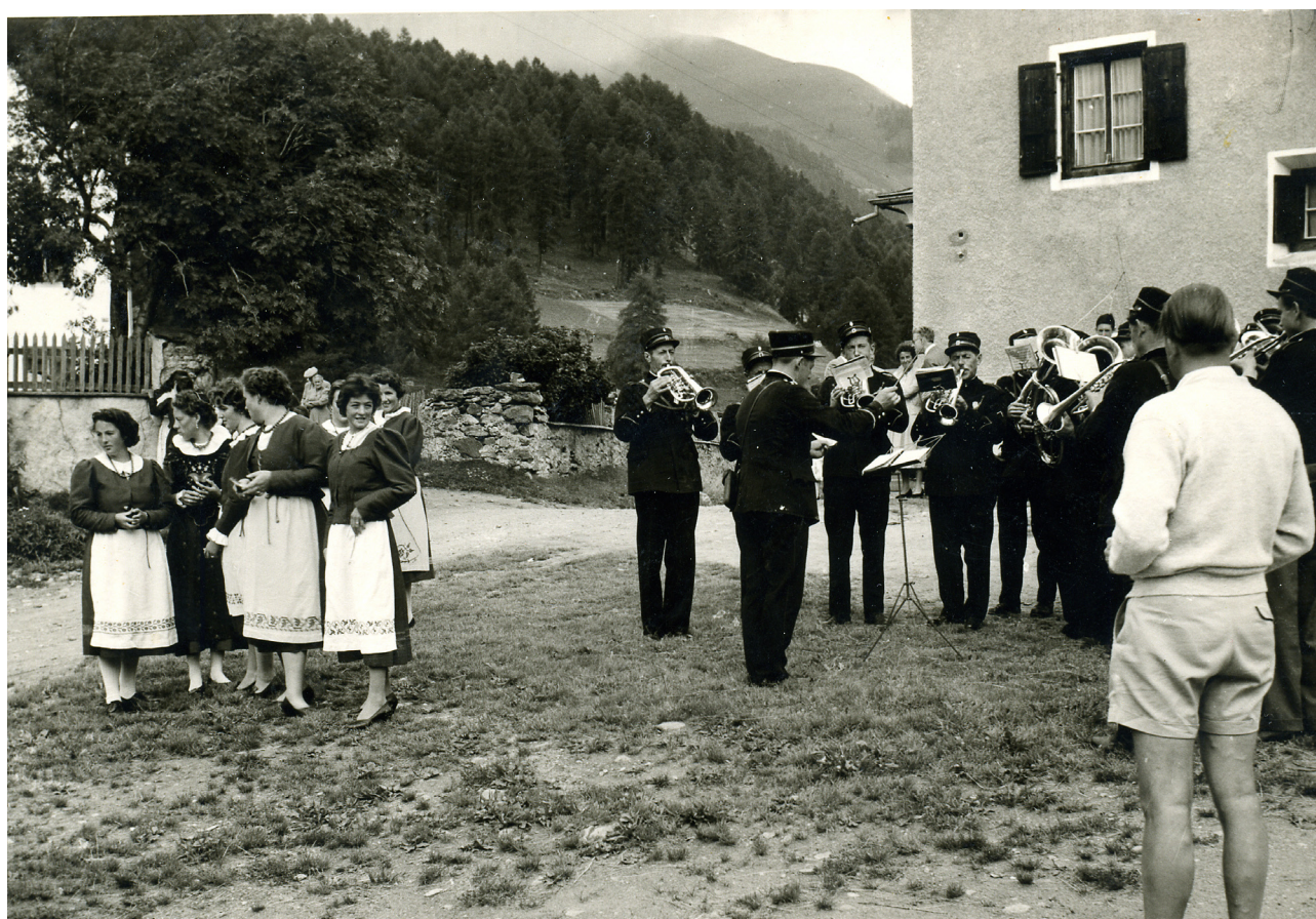
Producziun da nossa musica in unifuorma "verda" intuorn l'on 1958