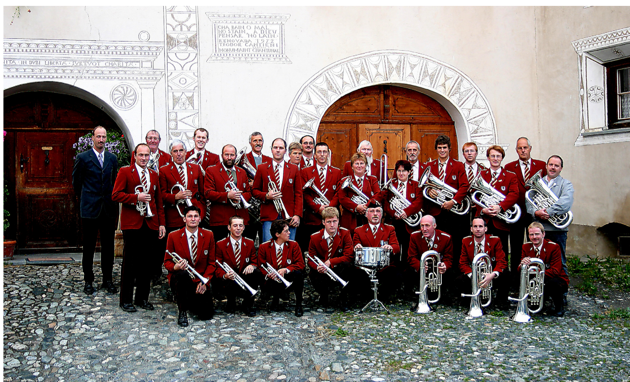
Concert Bügl Suot, 2 lügl 2004