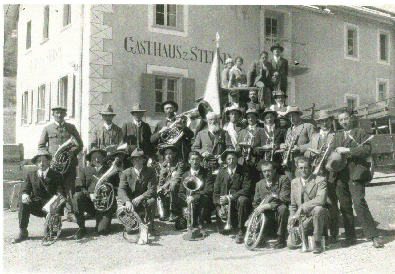
Festa chantunala a Domat / Ems 1937 (?)