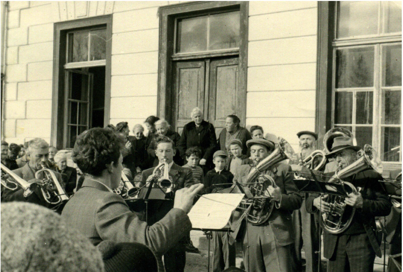
Schüschaiver l'on ?