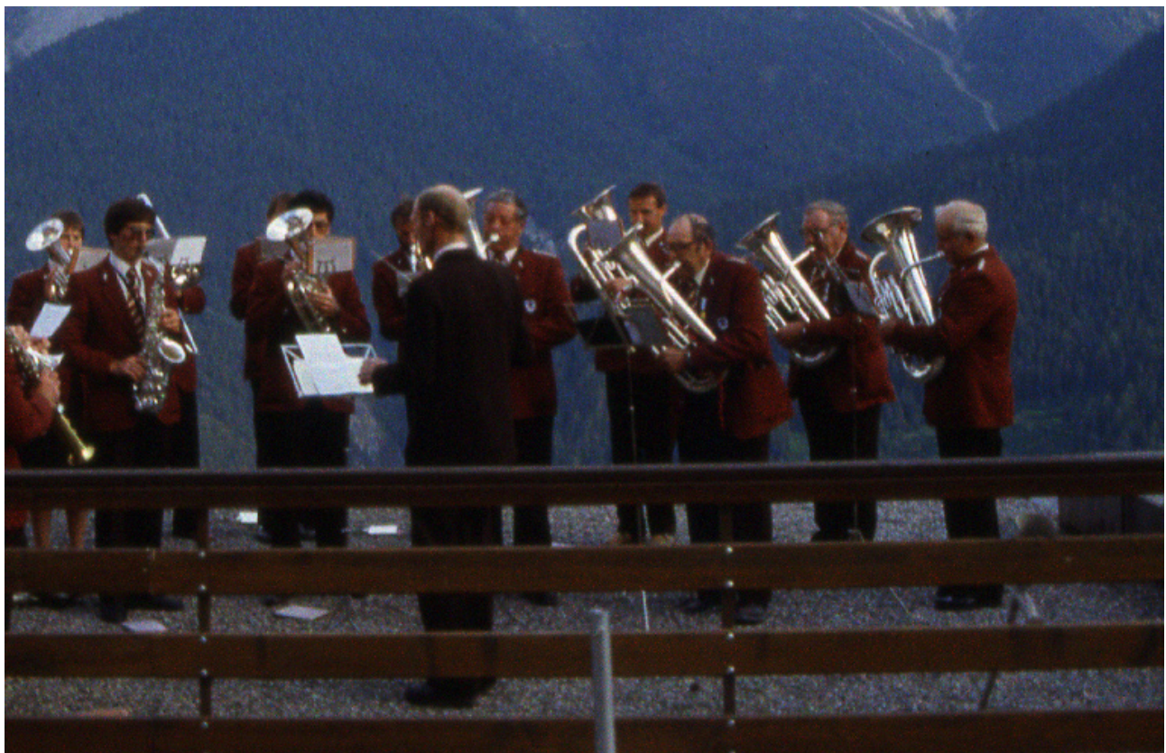
Concert als 1. avuost hotel Paradies