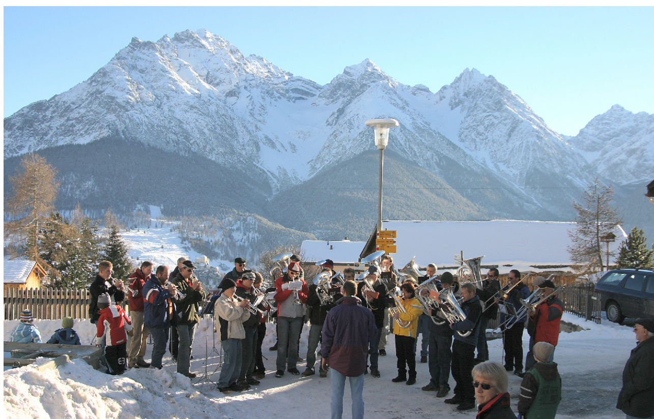
Silvester al cumanzamaint dal nouv millenium