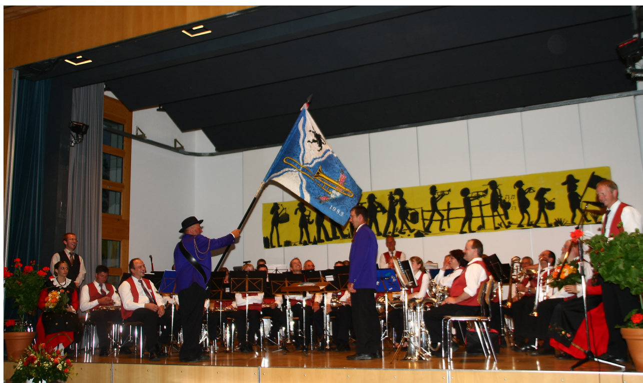
2009: Paul surdà la bindera a seis successur Riet