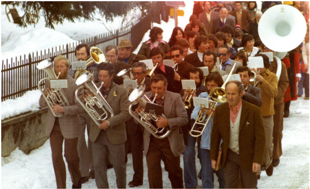
Schüschaiver l'on ?