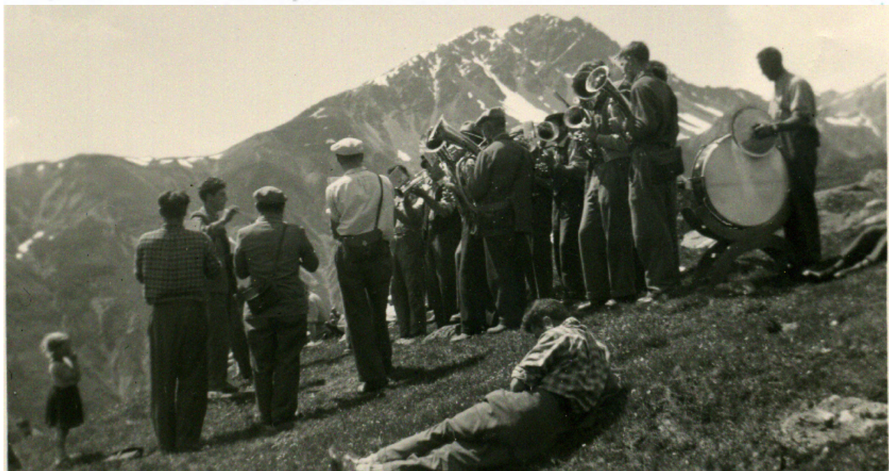
Masüras Alp Laret al cumanzamaint dals ons sesanta