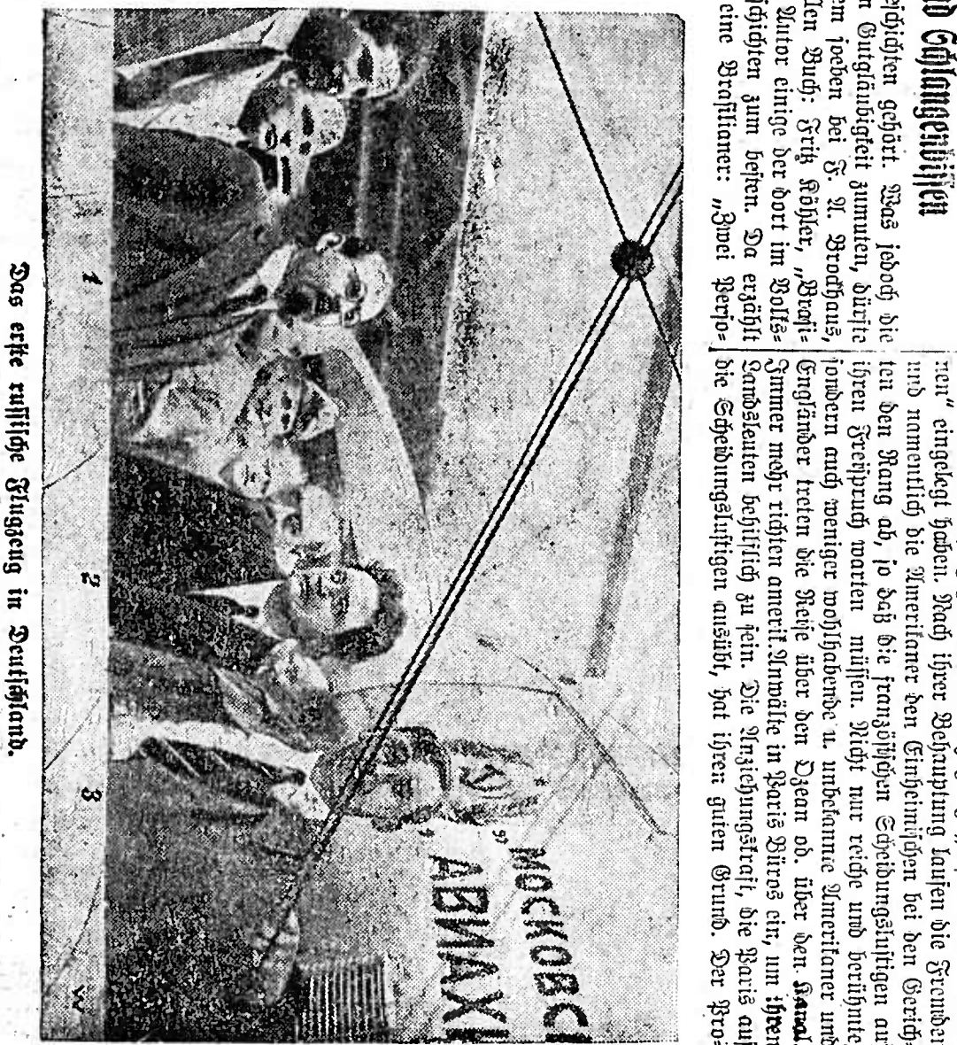
Das erste trübselige Gespräch in Sankt-Petersburg.

Die Schlangen und Schlangegeißeln hat man schon oft genug die Schlange ge- sehen. Sie ist ein Tier, das in der Natur nicht ohne Zweck zu sein scheint. Sie ist ein Tier, das in der Natur nicht ohne Zweck zu sein scheint. Sie ist ein Tier, das in der Natur nicht ohne Zweck zu sein scheint.