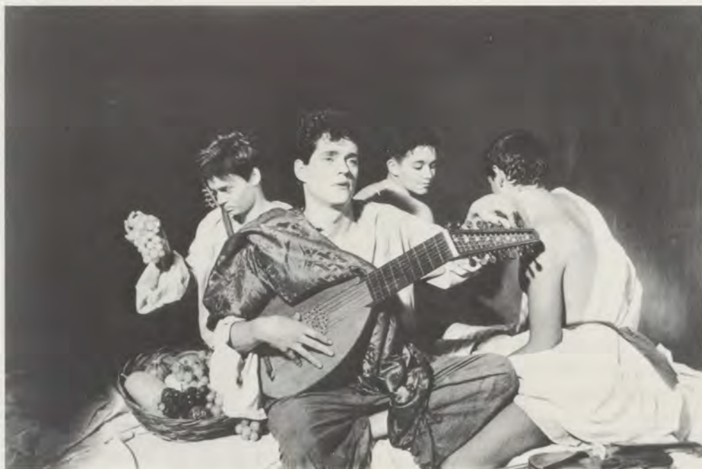
FROM/AUS «CARAVAGGIO», (35 mm) BY/VON DEREK JARMAN, 1986.

Hockney nicht unbedingt das Malen und Zeichnen der männlichen Figur in homosexuellem Kontext als sein Monopol betrachtete, bewirkte seine Bekanntheit doch, dass andere, die Gleiches versuchten, als blosse Nachläufer erschienen. «Home movies» zeigten jedoch einen neuen Umgang mit diesem Thema auf. Und sicher war in vielen Super-8-Filmen Jarmans der siebziger Jahre die Homosexualität ein entscheidender Bestandteil. Alles beherrschender Mittelpunkt war sie jedenfalls auch in seinem ersten Spielfilm SEBASTIANE, 1975. Darin stellte er Strafbarkeit und daraus folgende Gewalt einander gegenüber, die historisch unausweichlich mit der homosexuellen Erfahrung verbunden sind. Im Gegensatz dazu wird in THE ANGELIC CONVERSATION (DAS ENGELSGESPRÄCH), 1985, dessen Tonspur aus Shakespeares Sonnetten zusammengestellt ist, die homosexuelle Liebe mit nahezu mystischer Zärtlichkeit gezeichnet. Dem entspricht die verborgene Erzählstruktur des Films, die Jarman mit einem Pfad zum Paradies vergleicht.