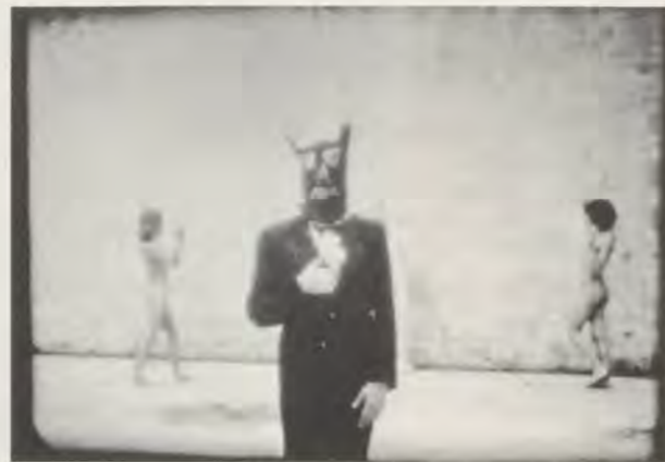
FROM/AUS «THE ART OF MIRRORS» / «DIE KUNST DER SPIEGEL», (SUPER-8 FILM) BY/VON DEREK JARMAN, 1973.

Von hier aus gibt es eine direkte Verbindung zu Jarman's Verfilmung von Shakespeares THE TEMPEST (DER STURM) von 1979, in der Prospero, von dem Jarman annimmt, dass Shakespeare ihn weitgehend nach Dees Vorbild entworfen hat, mit Hilfe seiner magischen Künste die Ordnung wiederherstellt, eine Ordnung, die auf Versöhnlichkeit beruht. Es ist kein Zufall, dass Jarman sich für den Film nicht eine entfernte tropische Insel ausgesucht hat, sondern die Seefahrer an der Küste North-