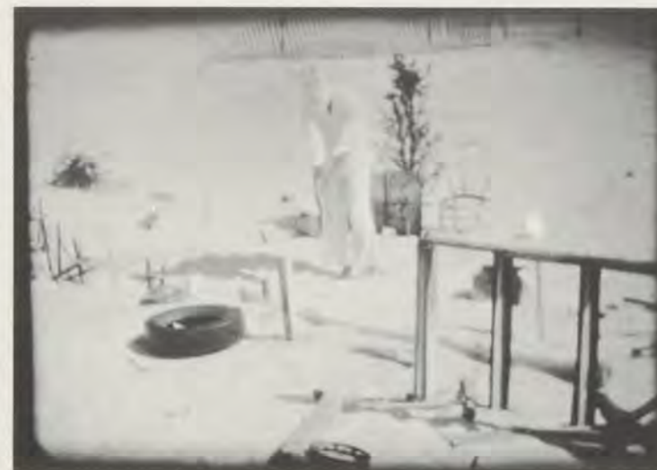
FROM/AUS «IN THE SHADOW OF THE SUN» / «IM SCHATTEN DER SONNE», (SUPER-8 FILM) BY/VON DEREK JARMAN, 1974.

Over the New Year of 1983-4 he was hard at work on a series of large gold, black and red paintings to be entitled G.B.H., in which through the thick swirls of paint could be made out the map of Great Britain, understood to be the target of a nuclear attack and now in flames. His paintings since then have continued to be dominated by gold, black and sometimes red, the alchemical implications of which are inescapable. The latest series, painted this September in response to his nomination for the Turner Prize, are his best and most concentrated to date. Their high quality, however, is largely accountable for by their lack of recognizable references; and this, from Jarman's own point of view, is a distinct limitation. By contrast, one of the two