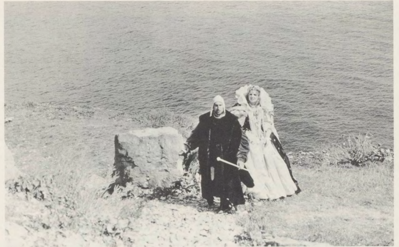
FROM/AUS «JUBILEE», BY/VON DEREK JARMAN, 1977.