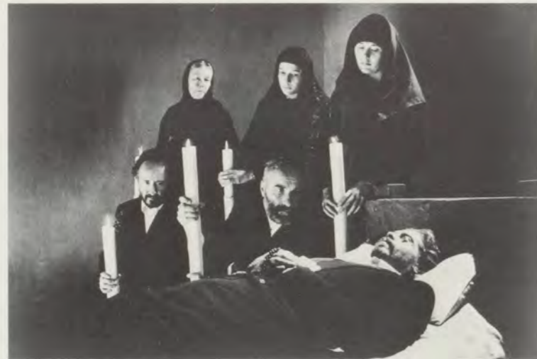
FROM/AUS «CARAVAGGIO», (35 mm) BY/VON DEREK JARMAN, 1986.