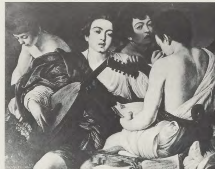
MICHELANGELO CARAVAGGIO, CONCERT (1593–94), NEW YORK, METROPOLITAN MUSEUM OF ART.