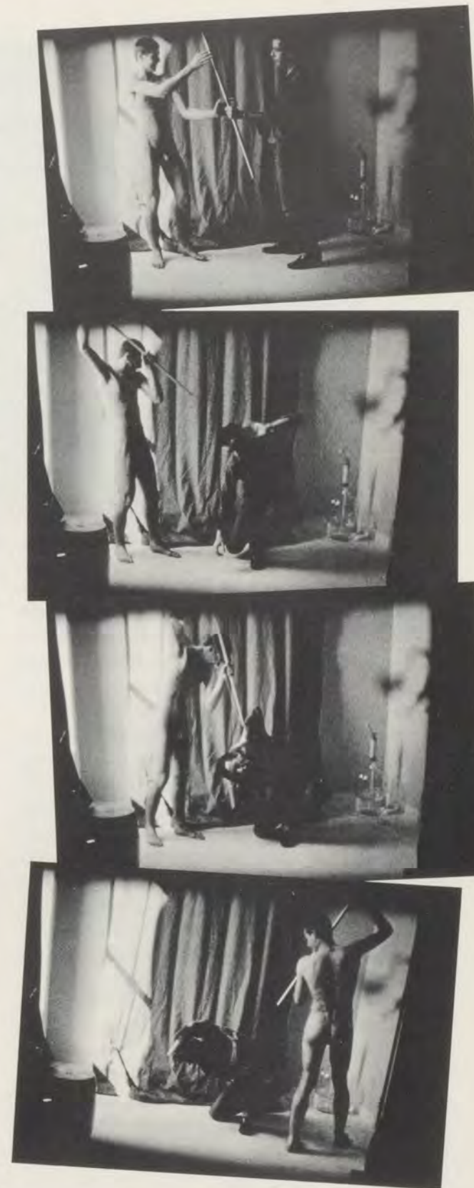
FROM/AUS «DREAM MACHINE» / «TRAUM MASCHINE», (SUPER-8 FILM) BY/VON DEREK JARMAN, 1978.

Als er 1970 zum ersten Mal eine Super-8-Kamera benutzte, hatte dies unmittelbar befreiende Wirkung. Es half ihm, die Leblosigkeit seiner geometrischen Landschaftsbilder zu überwinden. Sein Leben und seine Umgebung fanden Eingang in seine Arbeit, angefangen bei Filmen, die er von seiner Wohnung und von Freunden drehte. Ein Problem, mit dem sich alle jungen homosexuellen Maler dieser Generation in England auseinandersetzen mussten, bestand in einer gewissen «geschwisterlichen» Rivalität mit David Hockney: Während