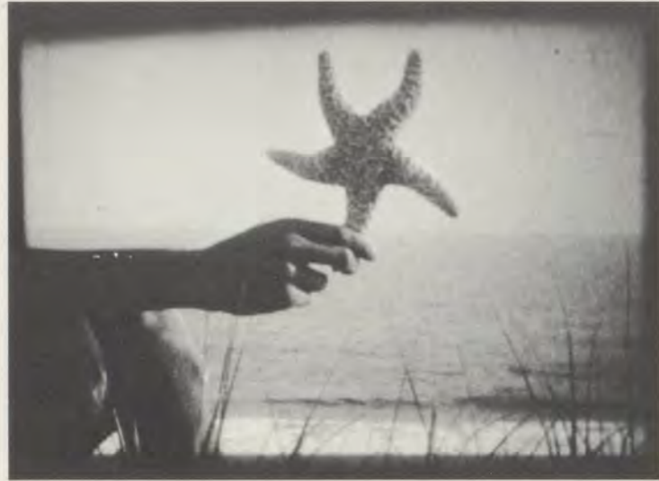
FROM/AUS «HOME MOVIES», (SUPER-8 FILM) BY/VON DEREK JARMAN, 1972.