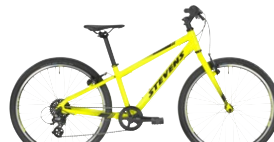
▶ 24" // Neon Yellow