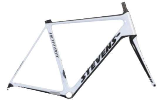
► Carrara White