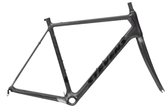
► Phantom Grey