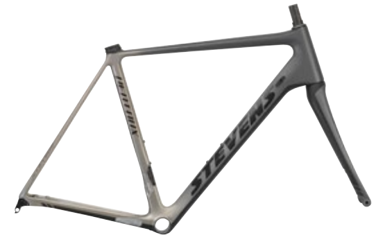
► Slate Grey