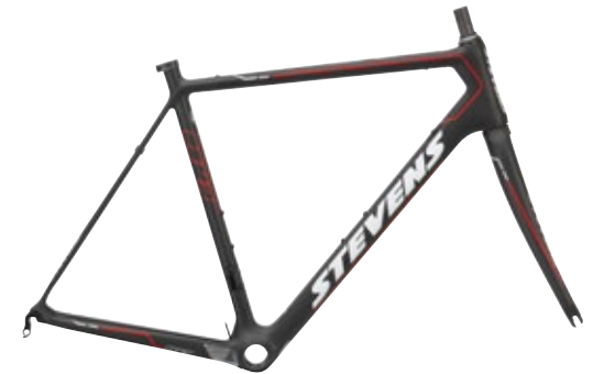
► Ink Black