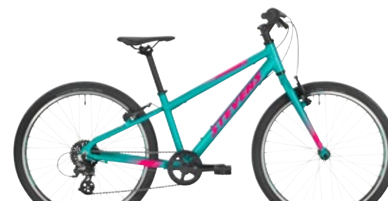
▶ 24" // Bright Turquoise