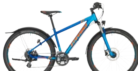
› 27,5" // Deep Sea Blue