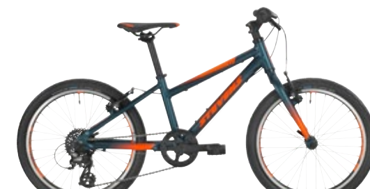
▶ 20" // Moonlight Blue